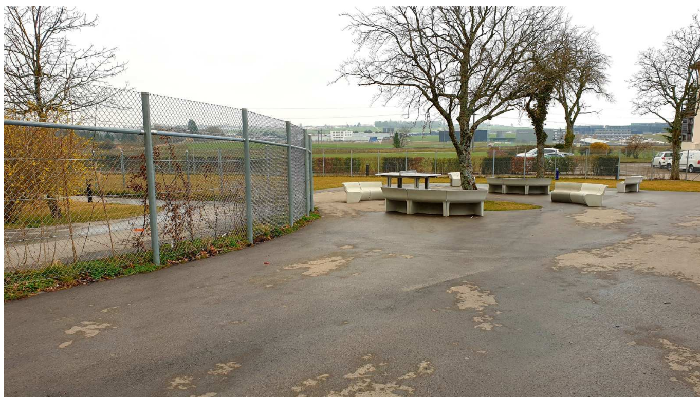
Двор миграционного центра

Весь день ушел на заполнение бумаг, ожидание и интервью с сотрудниками Caritas и офицерами миграционной службы. Суровая, с вежливой улыбкой офицер спросила меня, где бы я хотел жить. Я попросил уточнить вопрос и, если можно, дать варианты на выбор. Мне показалось это логичным, разве нет? Но дама-офицер холодно и хлестко отчитала меня с той же вежливой улыбкой: дескать, они пытаются спасти людей, в то время как я пытаюсь выбрать вариант получше. Было стыдно, но всё равно непонятно. Если я должен был произвольно называть место, то она могла бы сразу мне это место назначить, а не вгонять в краску нотацией. В итоге я сказал, что хотел бы жить в швейцарской семье.