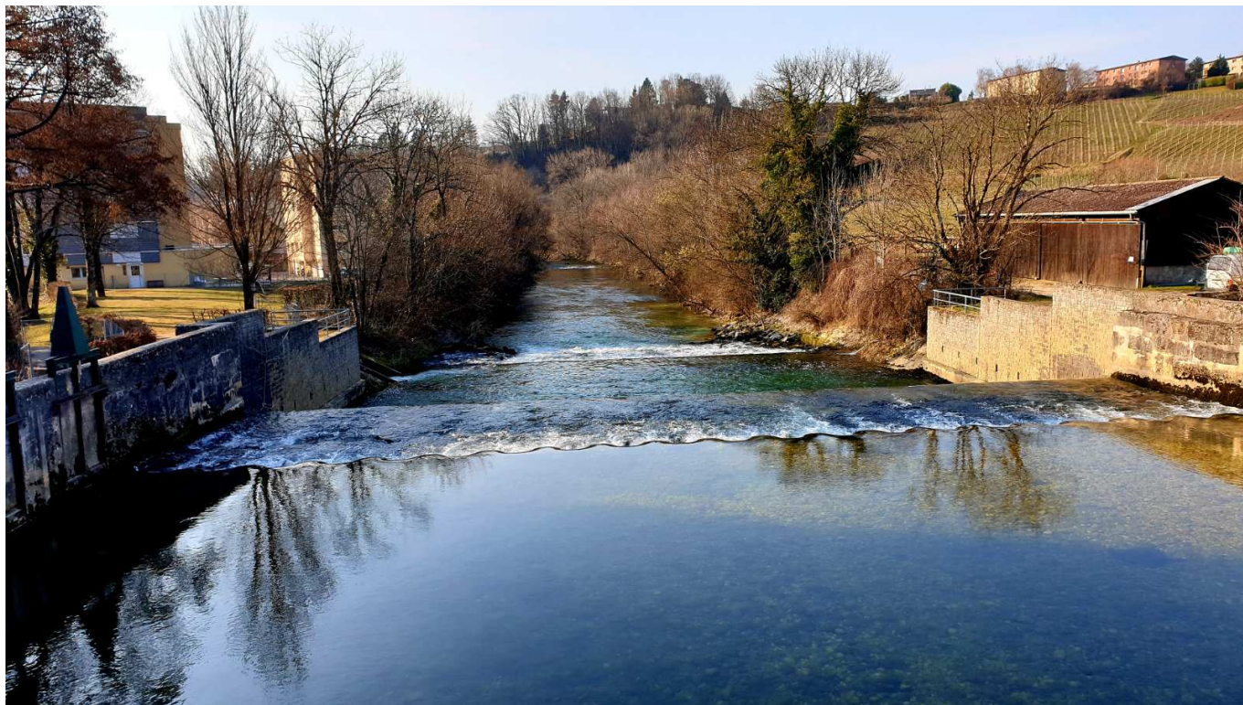
Живописная река L'Areuse

Каждый час возникали проблемы: кому-то нужны были лекарства, кому-то памперсы, кому-то перевод. Надо сказать, что в Будри в целом прекрасно подготовились к приему, но на тот момент было еще мало переводчиков или хотя бы англоговорящего персонала. Я зацепился за одну миниатюрную блондинку с надписью «Protectas» на спине, которая была мало того, что фантастически красива, так ещё и на английском говорила бегло! И я не отпускал её ни на минуту. Мы ходили вдоль очереди, собирали проблемы, я их переводил блондинке, она пыталась их решить.