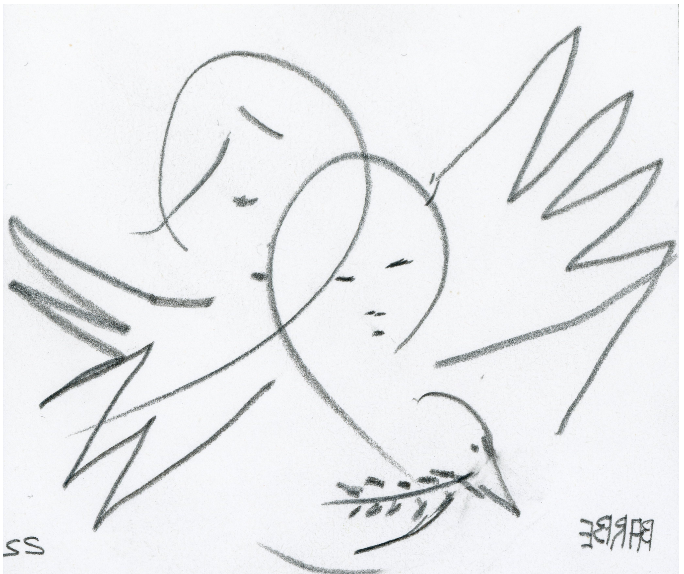
Рисунок художника Паскаля Барба послужил афишей предстоящего вечера

Автор: Надежда Сикорская, Женева , 03.06.2022.