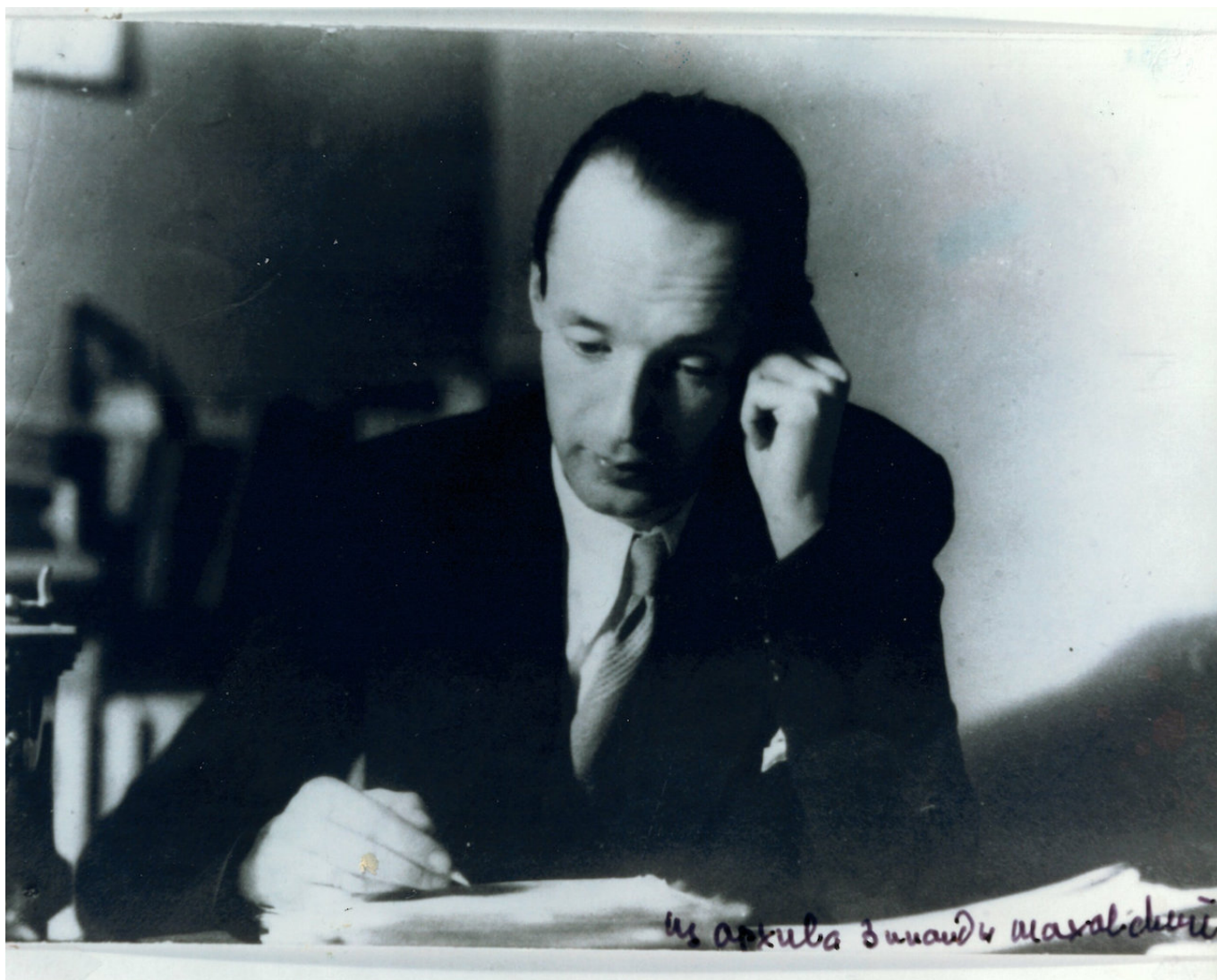
Молодой Владимир Набоков