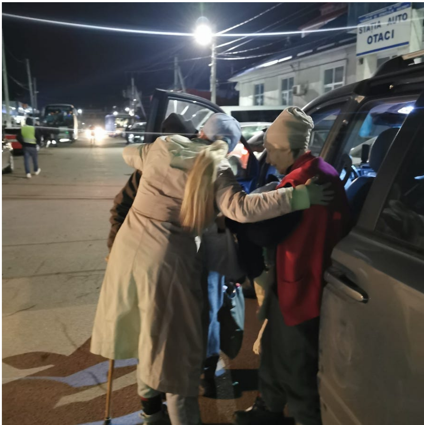
Встреча с родителями

есть люди, которые приехали из Украины и которым нужна помощь. Мне все время кажется, что я сделала еще очень мало. Пока что так. Это война».