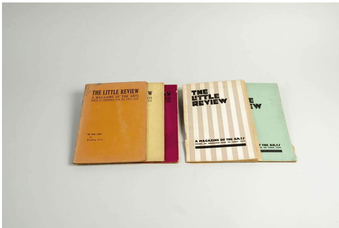
The Little Review

контрабандой. Американская писательница, издательница и основательница культового парижского книжного магазина «Шекспир и компания», под брендом которого роман и был впервые опубликован, Сильвия Бич использовала судебный процесс в Америке для рекламы книги в Европе. 2 февраля 1922 года Сильвия Бич пришла на Лионский вокзал в Париже в ожидании поезда, прибывавшего из Дижона в 7 утра. Проводник передал ей пакет, в котором было два экземпляра «Улисса» – один для нее, а другой для автора. В этом издании впервые были опубликованы запрещенные ранее эпизоды. Менее чем через 10 минут Бич уже звонила в дверь Джойса, жившего тогда в Париже. В руках у нее была книга – подарок к 40-летию писателя. Более того, Бич также разместила на видном месте в магазине «Шекспир и компания» плакат, сообщающий о публикации язвительной рецензии в британской газете Sporting Times . Будучи прирожденной пиарщицей, она обернула скандал в свою пользу.