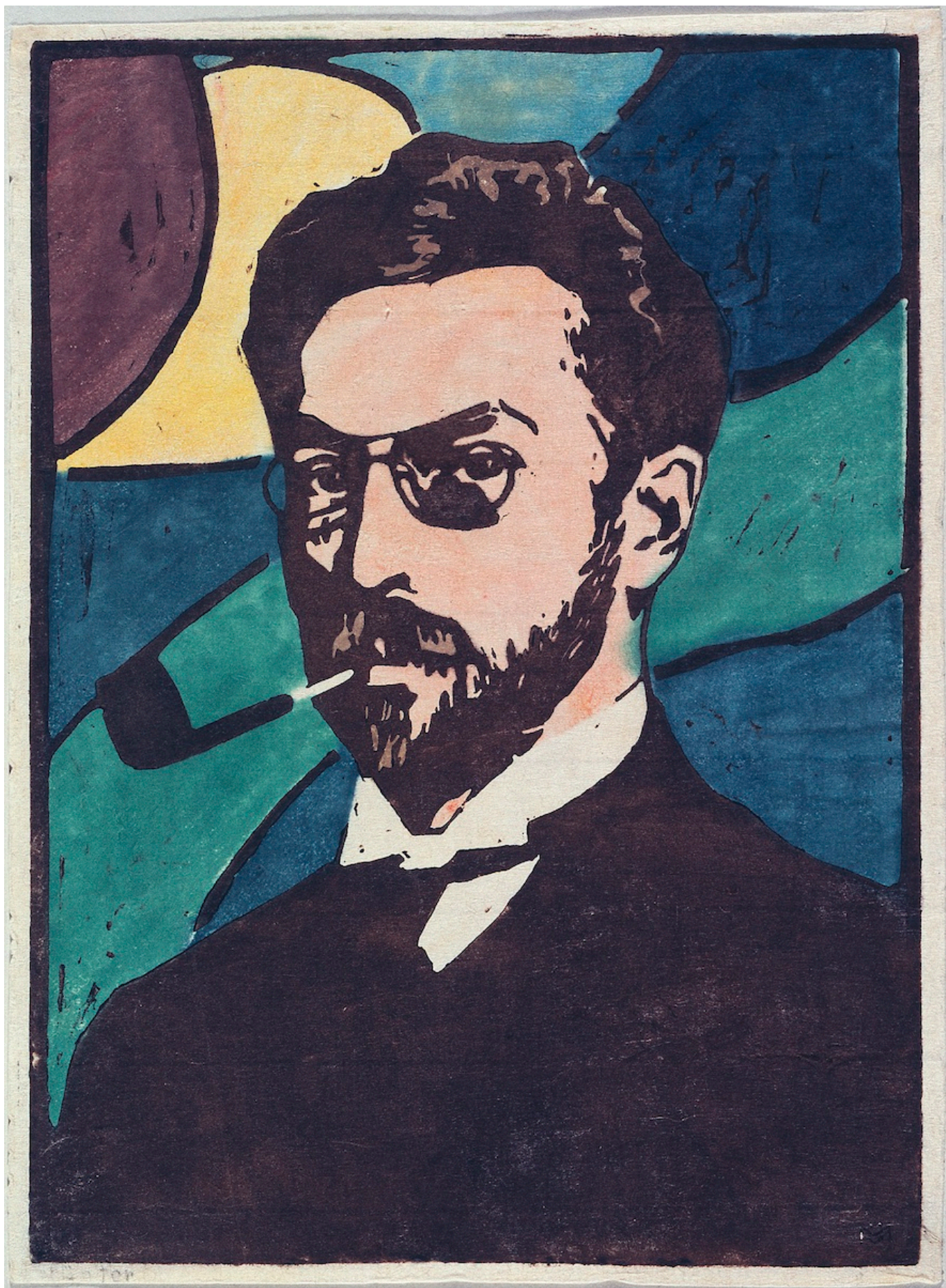
Gabriele Münter Kandinsky, 1906 Linogravure en couleur sur papier japon 24,4 x 17,7 cm Städtische Galerie im Lenbachhaus und Kunstbau München, Gabriele Münter Stiftung 1957 © 2021, ProLitteris, Zurich