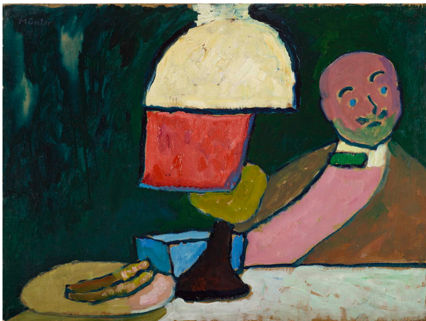
Gabriele Münter Zuhören (Bildnis Jawlensky) [A l'écoute (Portrait de Jawlensky)], 1909 Huile sur carton 49,8 x 66,4 cm Städtische Galerie im Lenbachhaus und Kunstbau München, Gabriele Münter Stiftung 1957

Вернувшись в Мюнхен, Мюнтер и Кандинский решили прекратить путешествия и начали искать подходящее место для жительства – им стал городок Мурнау, где в 1909 году Габриэле купила дом. Вместе с Кандинским они обставили виллу, разбили сад, расписали мебель по собственным эскизам. Пейзажи Мурнау и ближайшие окрестности стали важным источником вдохновения для обоих художников. Дом Мюнтер в шутку называли «русским», так как частыми гостями там были Алексей Явленский , Марианна Веревкина и другие авангардисты. Бродить по выставке и узнавать известных художников, изображенных на портретах Мюнтер, – это отдельное удовольствие. Вот Кандинский с острой бородкой, вот Веревкина в импозантной шляпе, вот розовощекий Явленский, вот еще одна забытая художница – чудесная Ольга фон Хартманн с большими грустными глазами, а вот и сам Пауль Клее в белых летних брюках.