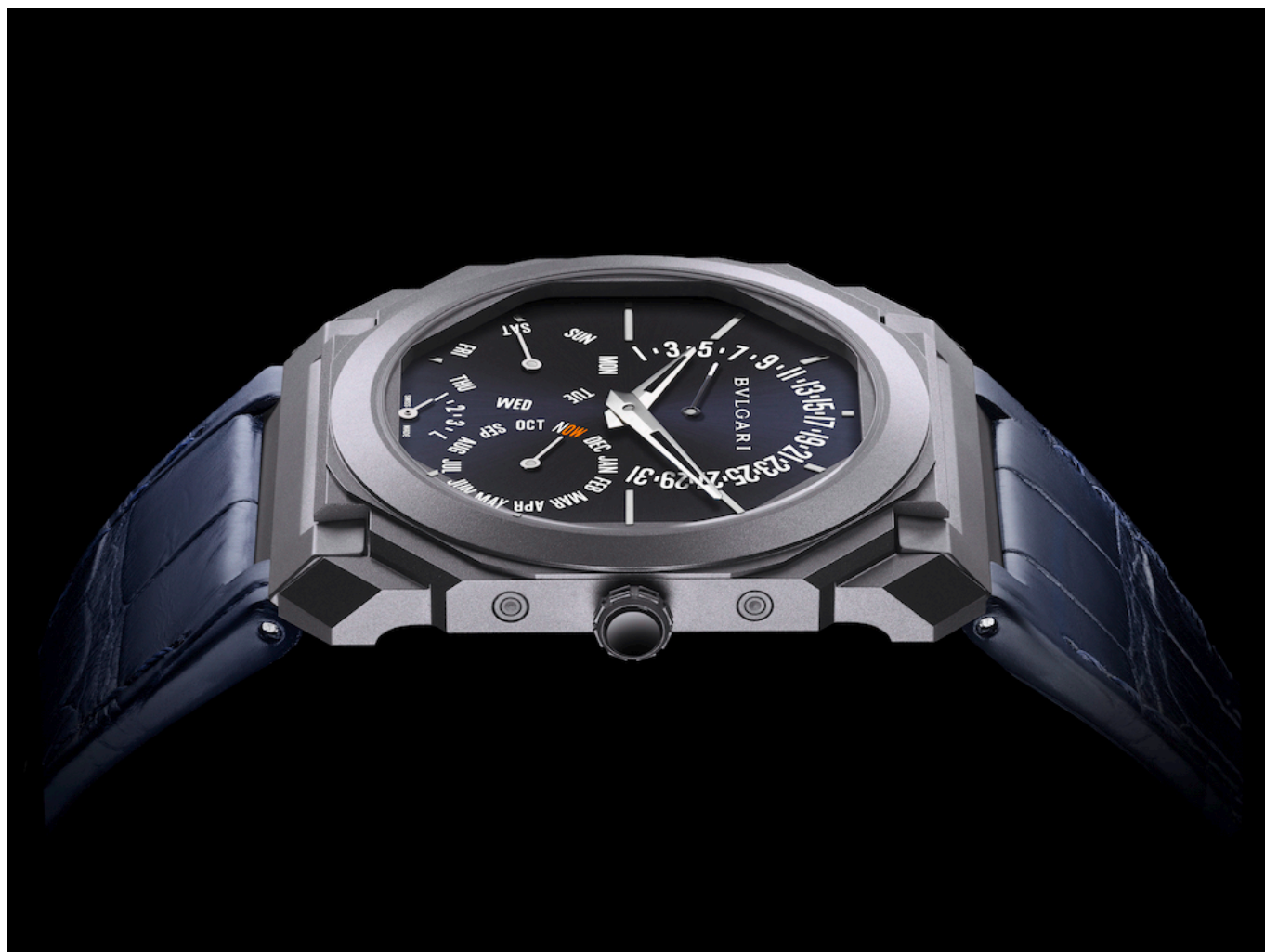
Octo Finissimo Perpetual Calendar Tantalum

Мировой рекорд. Чрезвычайно редкий металл, обладающий голубовато-серым тоном. Уникальное творение высокого часового искусства. Для своего первого участия в благотворительном аукционе Only Watch Дом Bulgari создаёт часы Octo Finissimo