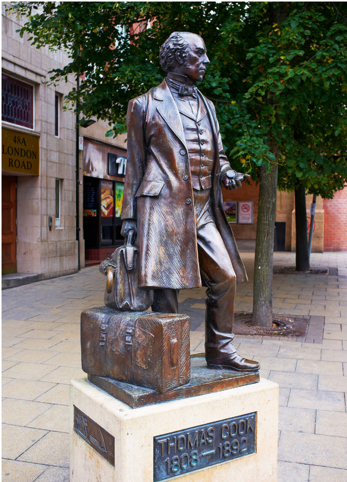
Памятник Томасу Куку возле вокзала в Лестере работы Джеймса Уолтера Батлера, установленный в 1994 году.