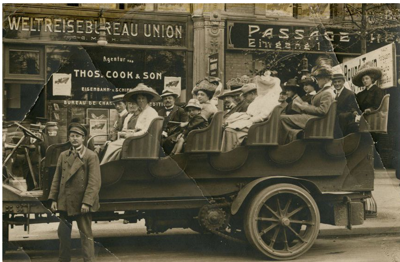
Туристы перед агентством Томаса Кука

Автор: Наталья Беглова, Женева , 24.12.2021.