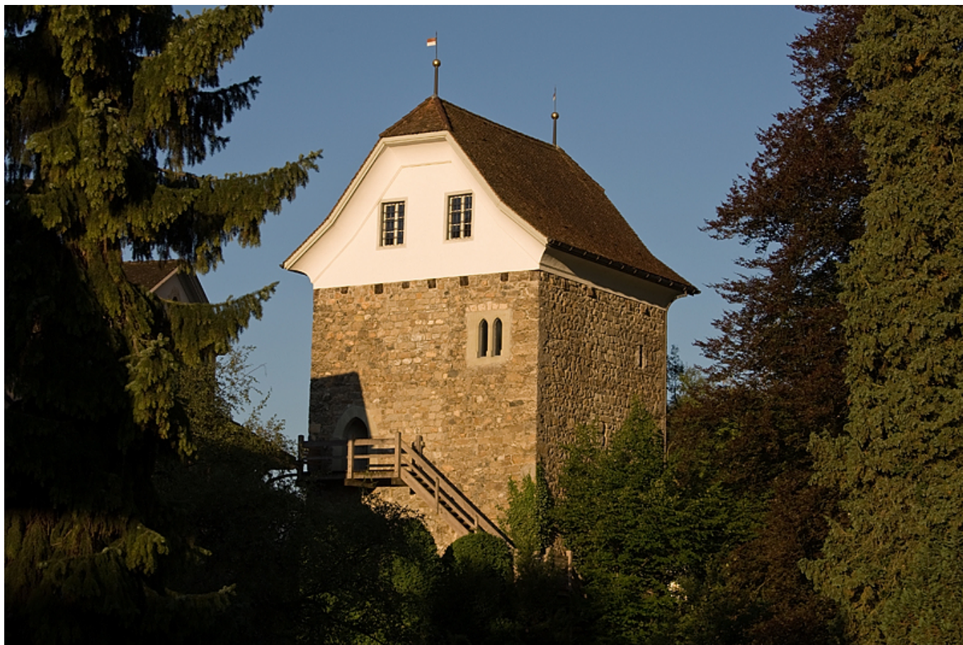
Башня ведьм в Зарнене

В 1507 году хронист Петерманн Эттерлин, служивший секретарем городского суда и городским летописцем Люцерна, перенёс часть текстов из Белой книги, в первую очередь историю Вильгельма Телля, в свою «Хронику Швейцарской конфедерации», первую печатную хронику Швейцарии. В середине XVI века историк и географ из Гларуса Эгидий Чуди, один из выдающихся политических деятелей Швейцарии времён Цвингли , соединил сведения из Белой книги и ряда других знакомых ему источников. В результате появилась популярная в течение нескольких столетий «История Швейцарии» (Chronicon Helveticum). наука не располагает исчерпывающими доказательствами об исторической достоверности ряда изложенных в ней событий, однако после создания Фридрихом Шиллером драмы «Вильгельм Телль» история из Белой книги получила всемирную известность, а её первый автор Шрибер оказался совершенно забыт – вот такая историческая несправедливость.