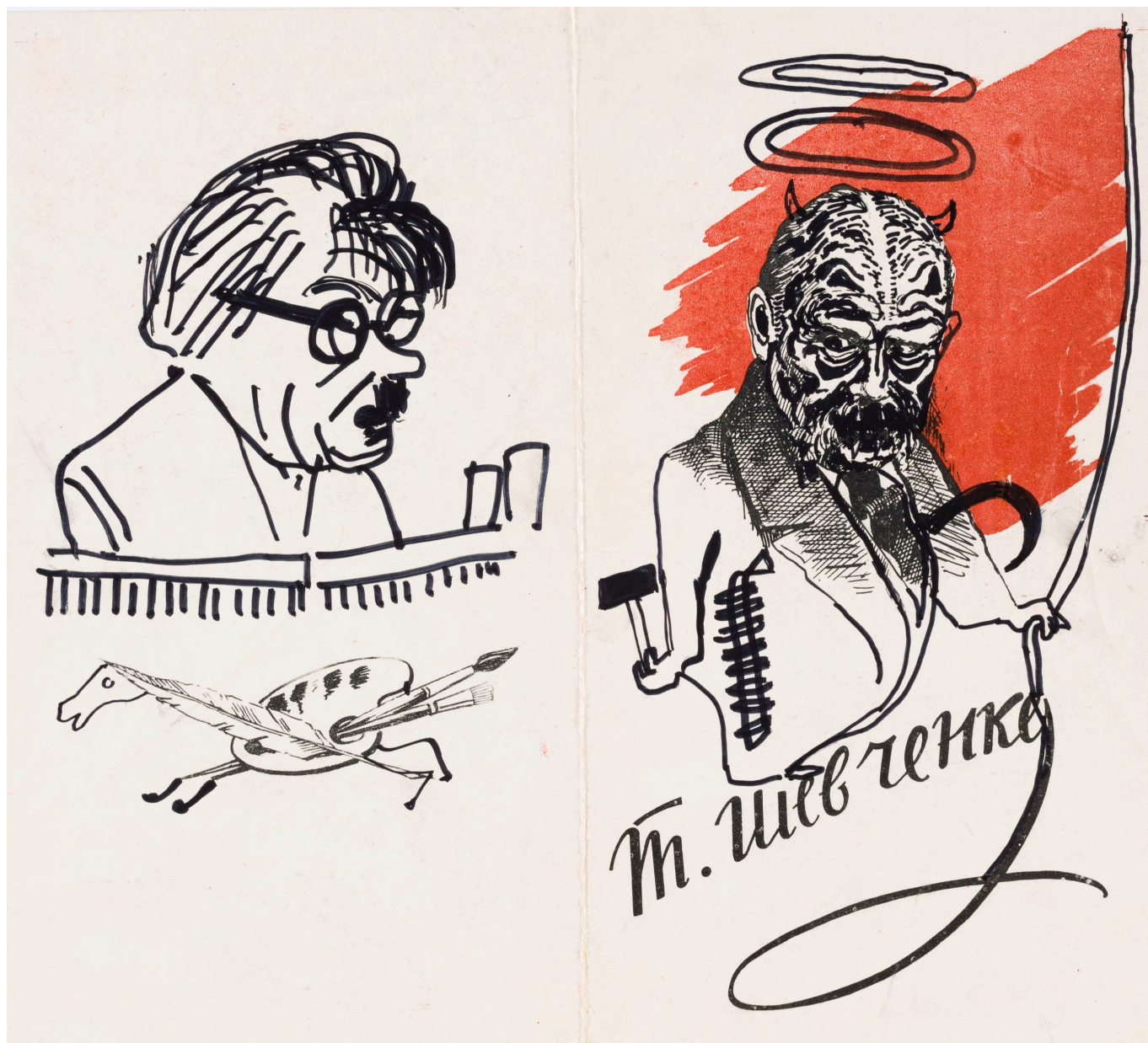
Рисунки на брошюре с портретом Тараса Шевченко, 1964 г. (с) CDN

Несмотря на явный интерес и симпатии к обеим сверхдержавам, Дюрренматт свободно критиковал как одну, так и другую: в случае СССР – за распад коммунистической идеологии, в случае США – за ультралиберальный капитализм и расовую сегрегацию. Как и многие интеллектуалы, Дюрренматт размышлял о третьем возможном пути, при этом не ввязываясь в политику. В речи, посвященной Пражской весне 1968 года, он так сформулировал свою позицию: «Я диагност, но не терапевт».