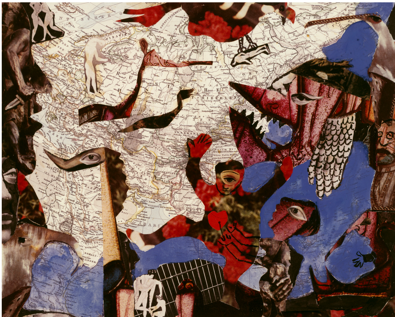
Фридрих Дюрренматт. Без названия, гуашь и коллаж на карте мира. Коллекция Беатрис Лишти

И вот в этом чудесном месте завтра открывается выставка, посвященная Дюрренматту-путешественнику. Куда же заносила его судьба?