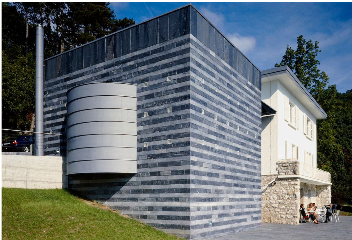
Центр Фридриха Дюрренматта в Невшателе

В Швейцарии продолжают отмечать столетие со дня рождения одного из самых знаменитых ее писателей.