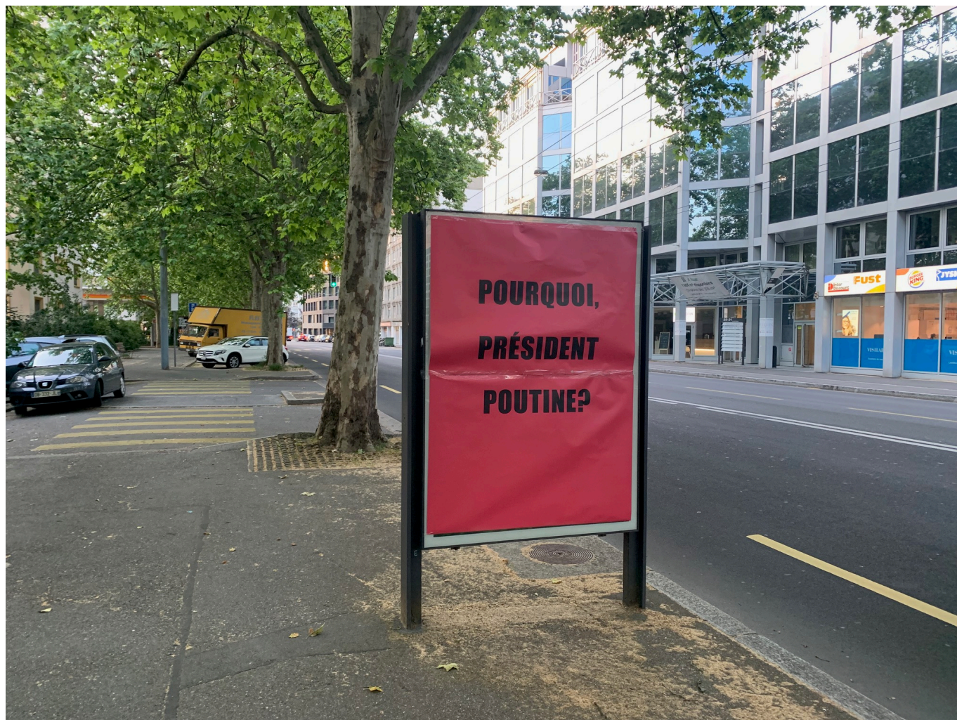
Президент Путин этим путем не поехал

... В полдень на огромном экране пресс-центра продолжали сменять друг друга беззвучные кадры: безлюдный парк Ла Гранж, безучастный фонтан, украшенный российскими и американскими флагами и совершенно пустой мост Монблан (движение по нему было остановлено), зеваки перед заграждением у отеля Four Seasons, суета в аэропорту в ожидании «с минуты на минуту» приземления российского борта № 1 – наш Илюшин, по мнению швейцарского комментатора, ни в чем не уступает самолету «Potus», то есть президента Байдена.