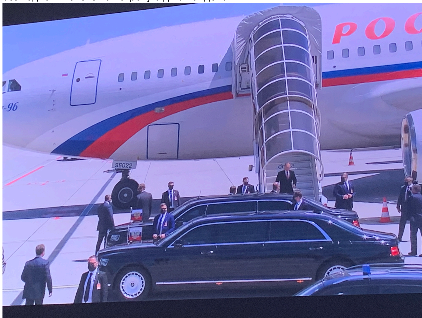
Президент Путин решил обойтись без протокола

Но вернемся... Легко сбежав по приставным ступенькам, Владимир Владимирович махнул – приветственно – рукой, и, словно по пресловутой Питерской, понесся по безлюдной Женеве на встречу с Джо Байденом.