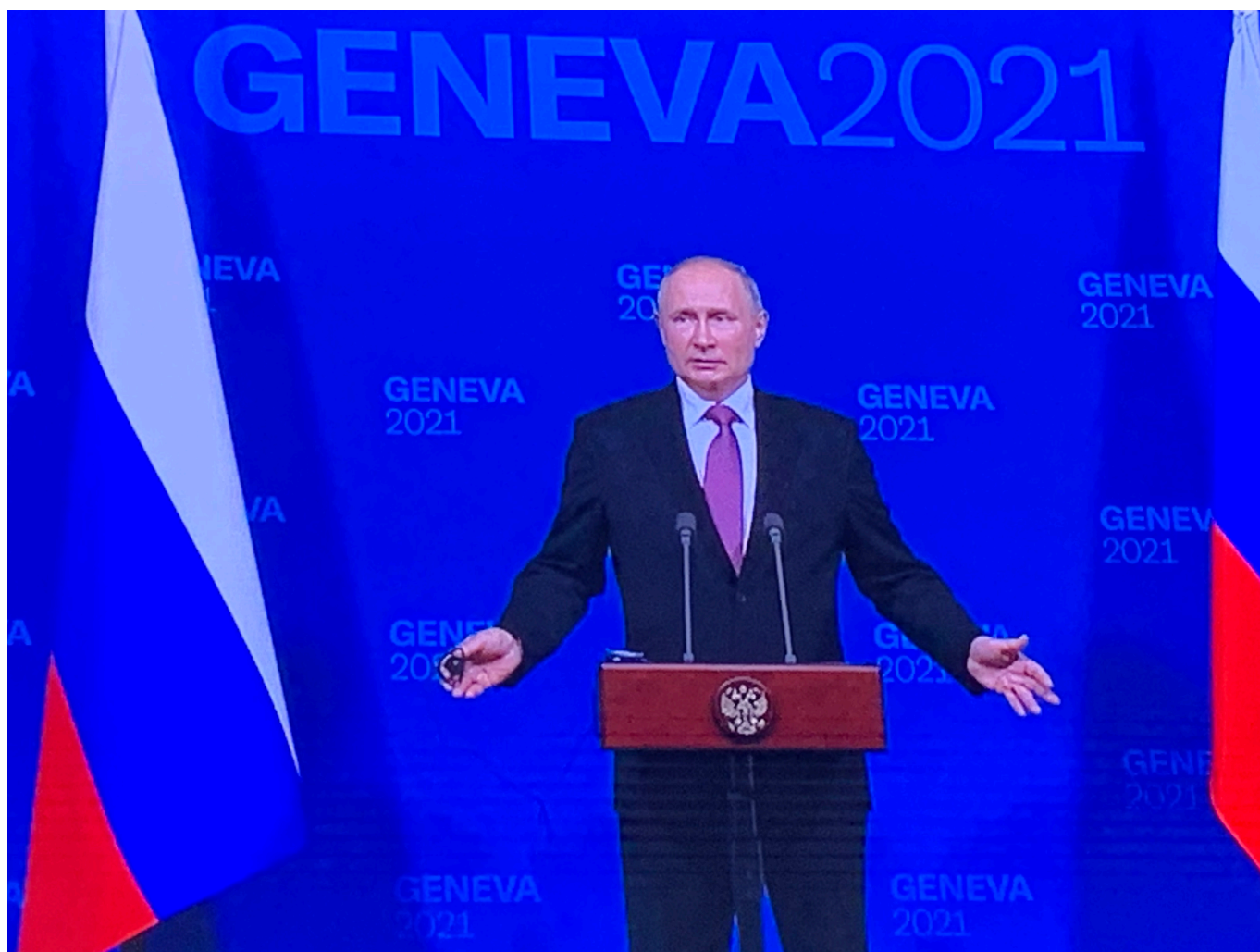
В. В. Путин после встречи с Джо Байденом. Скриншот

Обсуждался и вопрос обмена заключенными - по словам президента Путина, здесь «могут быть найдены компромиссы». Будем ждать конкретики. Но итоговым заявлением В. В. Путина мы считаем безапелляционное: «иллюзий нет, и быть не может». Завершая вчерашний день в студии RTS ( https://www.rts.ch/play/tv/emission/19h30?id=6454706 ), мы прокомментировали, в частности, именно эту фразу. Действительно, главе государства не обязательны иллюзии, тем более, что они имеют тенденцию разбиваться. Но видение мира ему необходимо! Увы, «картинка мира», рисуемая как одним президентом, так и другим не слишком вдохновляет.