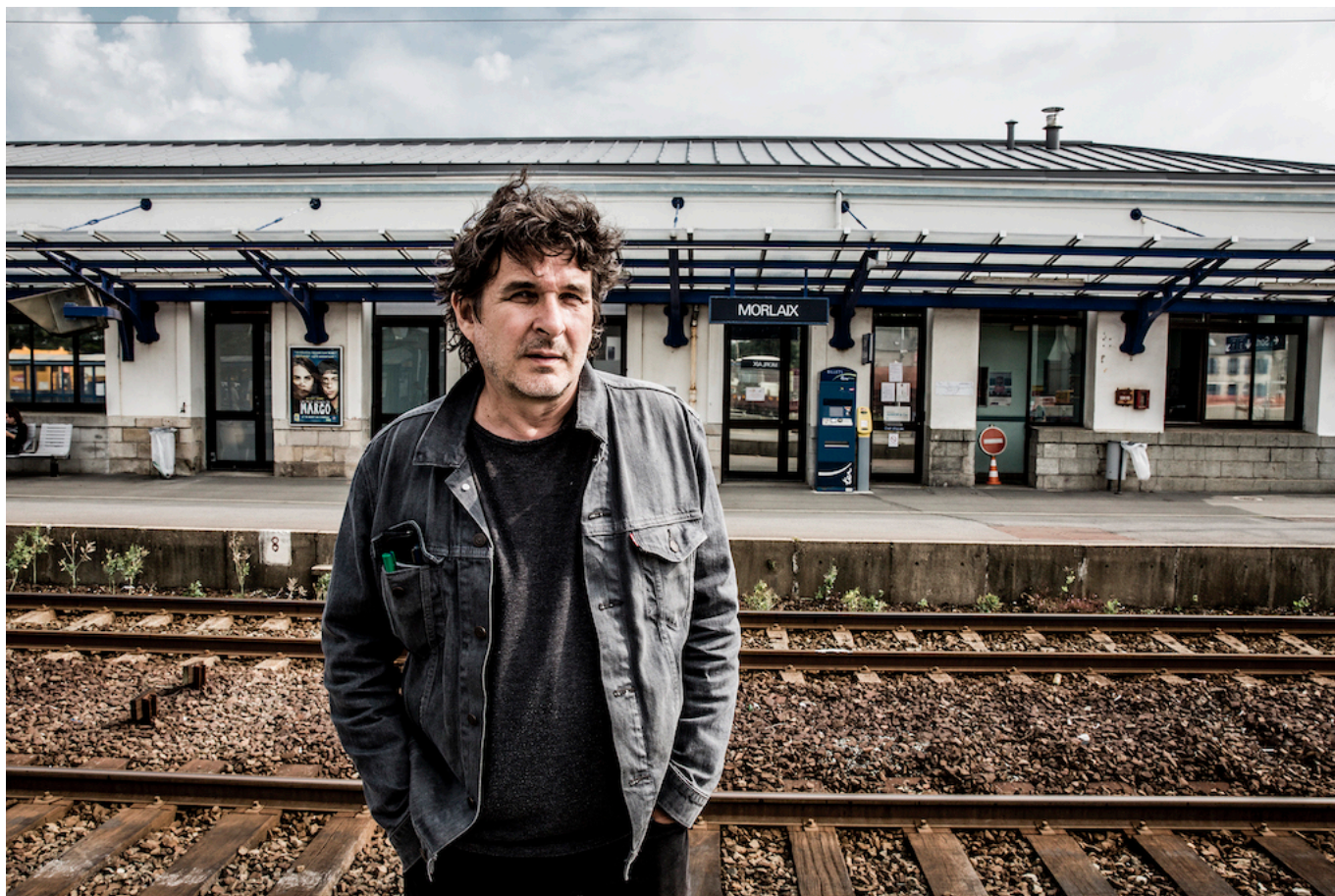
Писатель Фредерик Пажак

Сегодня в Золотурне должна была состояться торжественная церемония вручения Большой литературной премии Швейцарии. Церемония отменена, но интервью со счастливым обладателем премии Наша Газета заблаговременно подготовила.