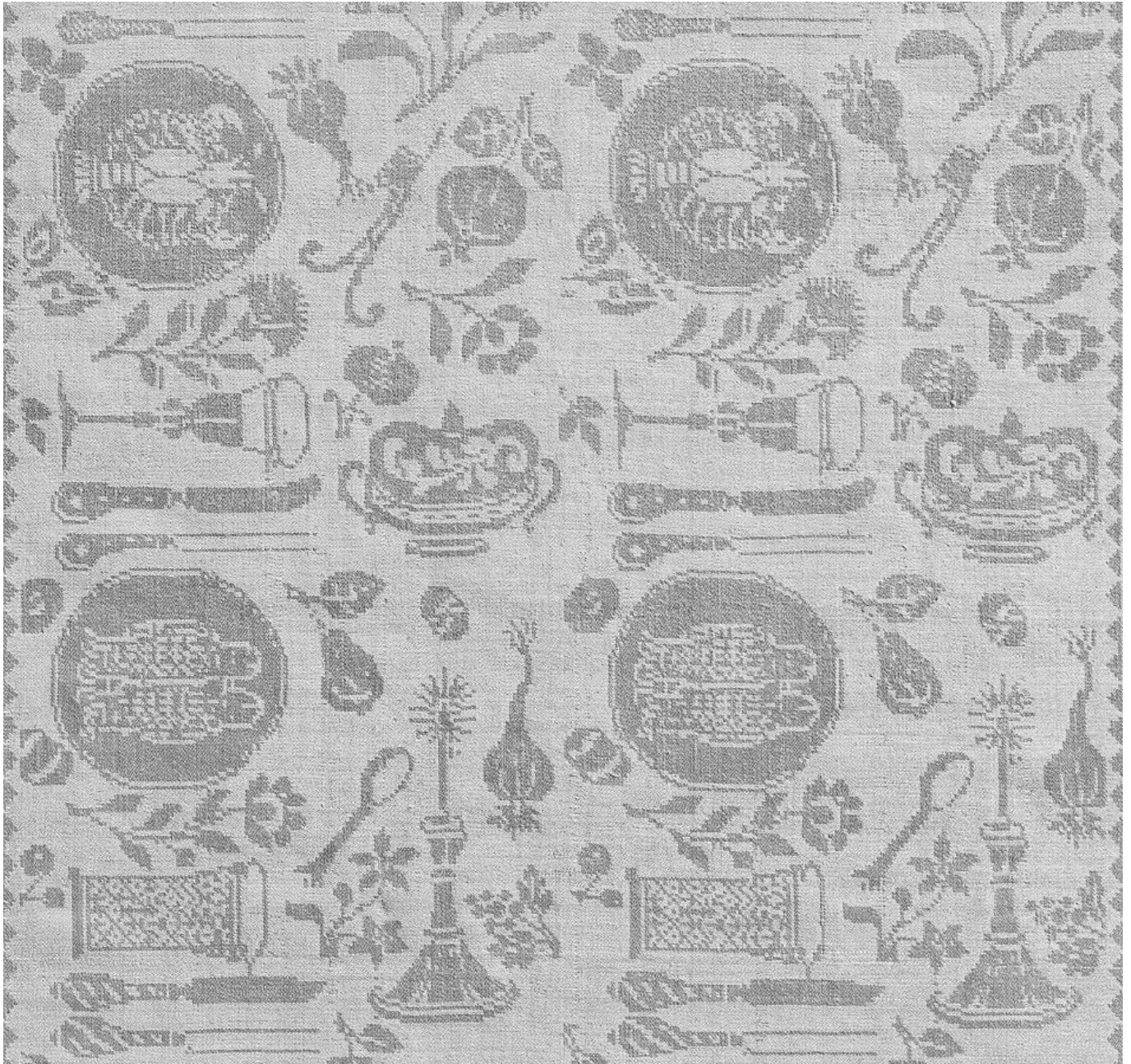
Салфетка с узором в виде сервированного стола. Саксония, около 1690 года, Фонд Абегг, инв. № 3196.

безупречных моральных качеств его обитателей.