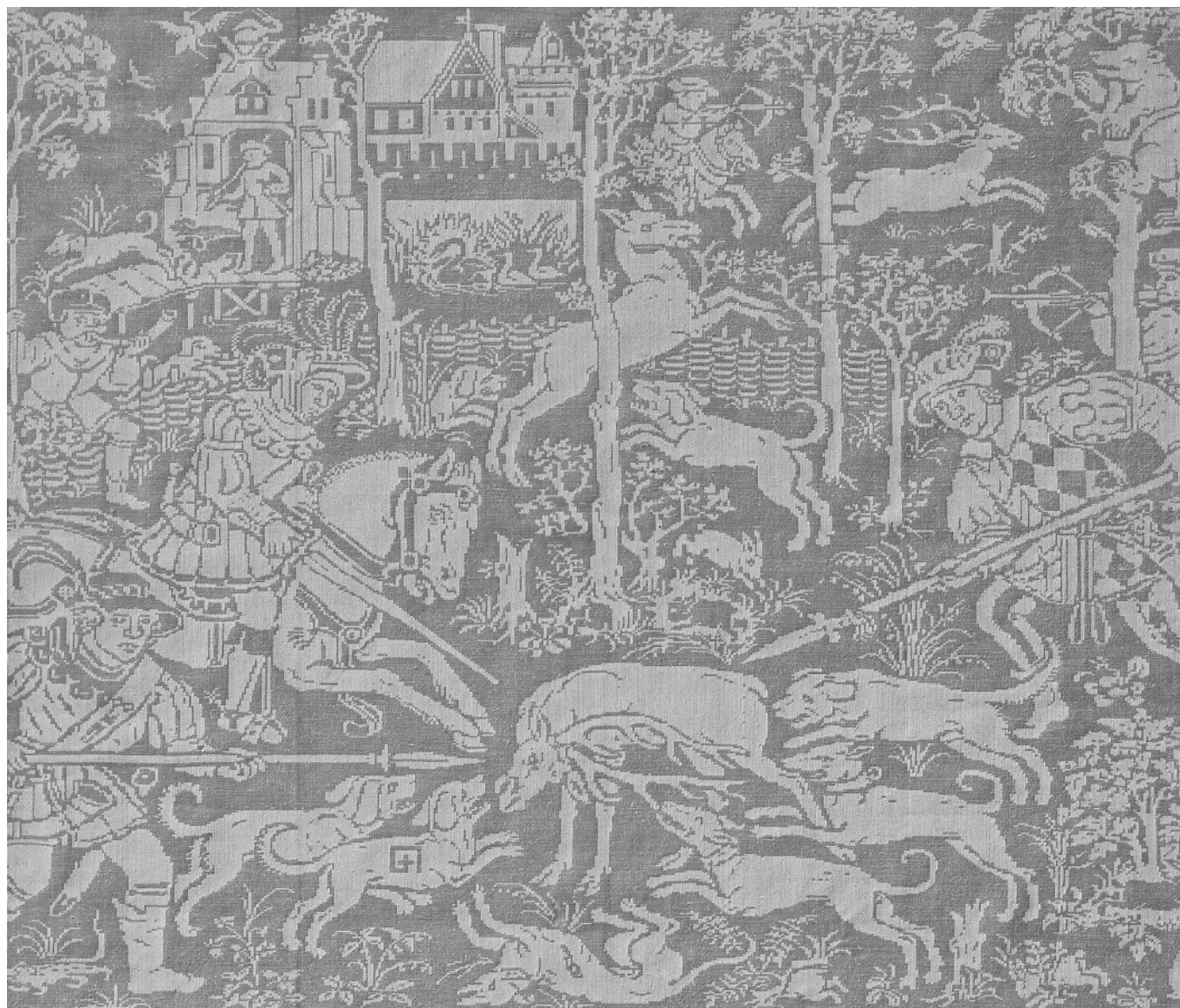
Салфетка с цветочным мотивом и сценой охоты – один из старейших сохранившихся льняных дамастов. Южная Голландия, Кортрейк (?), 1520-1530, Фонд Абега, инв. №

Выбранная тема кажется на редкость актуальной. Согласно статистике , во время пандемии резко выросли продажи товаров для дома, и в этом нет ничего удивительного. Никогда раньше мы, наверное, не проводили столько времени в четырех стенах, как во время сменяющих друг друга карантин и локдаунов, поэтому стремление сделать свой дом более уютным и комфортным совершенно понятно. Декораторы знают, что самый простой способ освежить обстановку – это сменить текстиль, например, купить новые скатерти. Когда же возник обычай накрывать стол белой тканью? Какими скатертями пользовались раньше? И как сервировали стол аристократичные и зажиточные семьи прошлых столетий? Фонд Абега предлагает «заглянуть на обед» к состоятельным голландским семьям эпохи Золотого века и узнать ответы на эти вопросы.