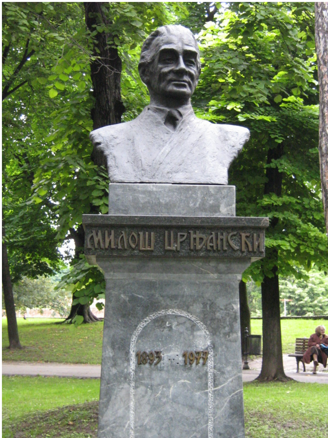
Памятник писателю в Белграде

Отдельная сложная тема – отношение Репнина к России. Несмотря на благородное происхождение и все пережитые разочарования, он не стал антисоветчиком, наоборот, мечтал бы вернуться на Родину, которая по-прежнему видится ему страной