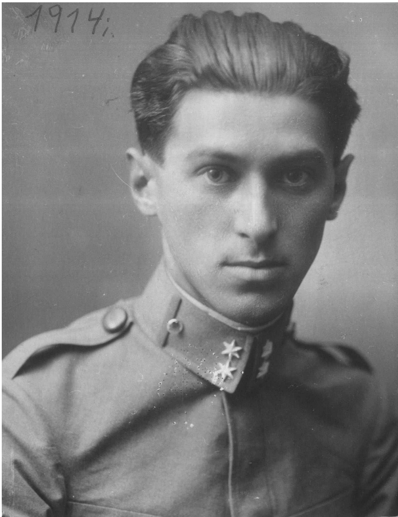
Милош Црнянский в 1914 г.

В центре повествования – чета белых эмигрантов, после многолетних скитаний осевшая в послевоенном Лондоне. Действие начинается накануне наступления нового, 1947 года. Наши герои, прошедшие беззаботную юность в Санкт-Петербурге, теперь – нищие иностранцы, «перемещенные лица», судьба которых не волнует