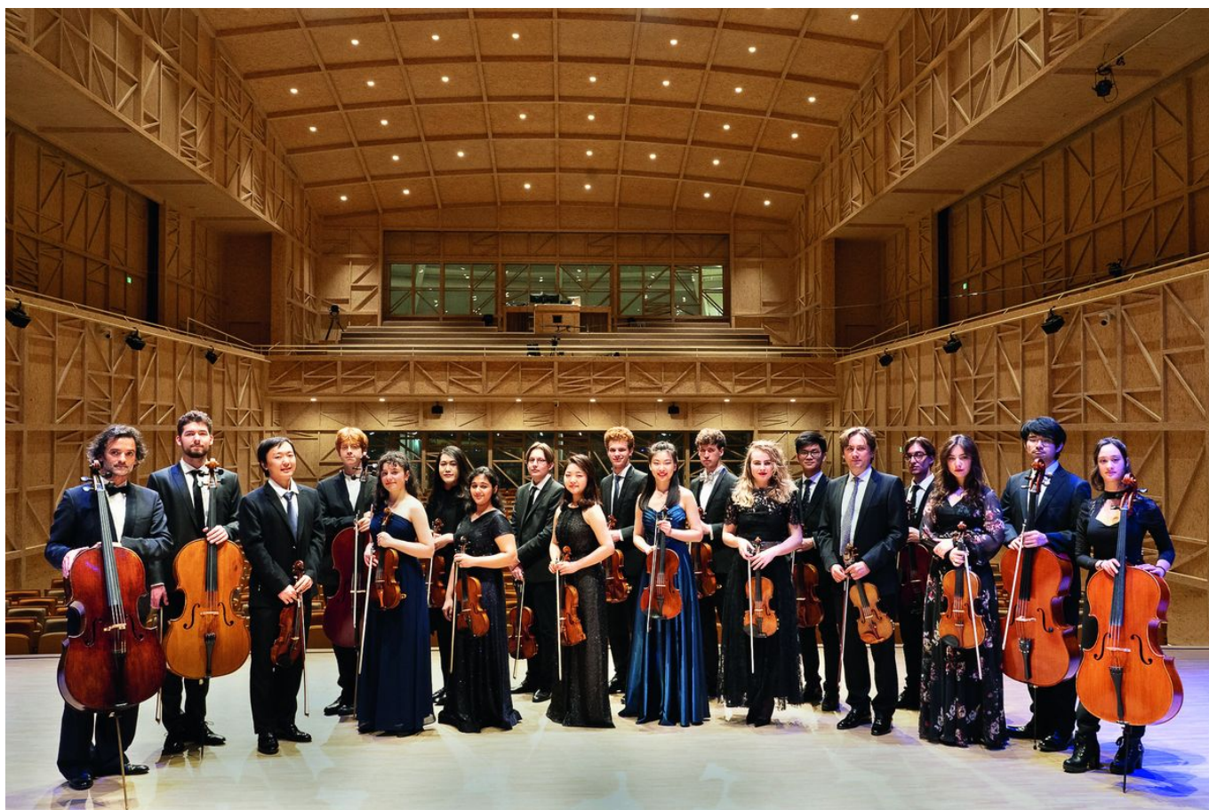
Солисты Академии Менухина

Автор: Надежда Сикорская, Роль , 22.01.2021.