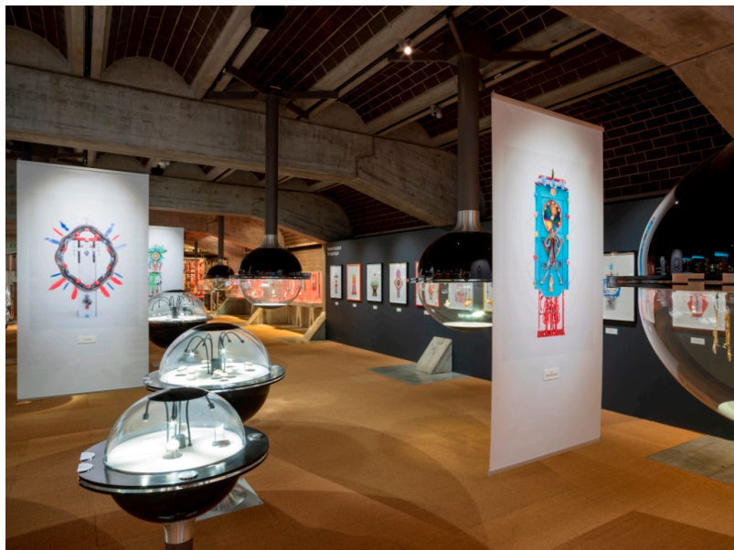
Фото с выставки в Международном музее часового искусства

Добавим, что в Международном музее часового искусства (МИИ) в Ла Шо-де-Фоне проходит временная выставка «Передача. Фотографии нематериальных ценностей» по случаю внесения часового искусства в список культурного наследия человечества. Экспозиция подготовлена совместно с Музеем времени Безансона (Франция), двери которого, к сожалению, пока закрыты в связи с ухудшением эпидемиологической обстановки.