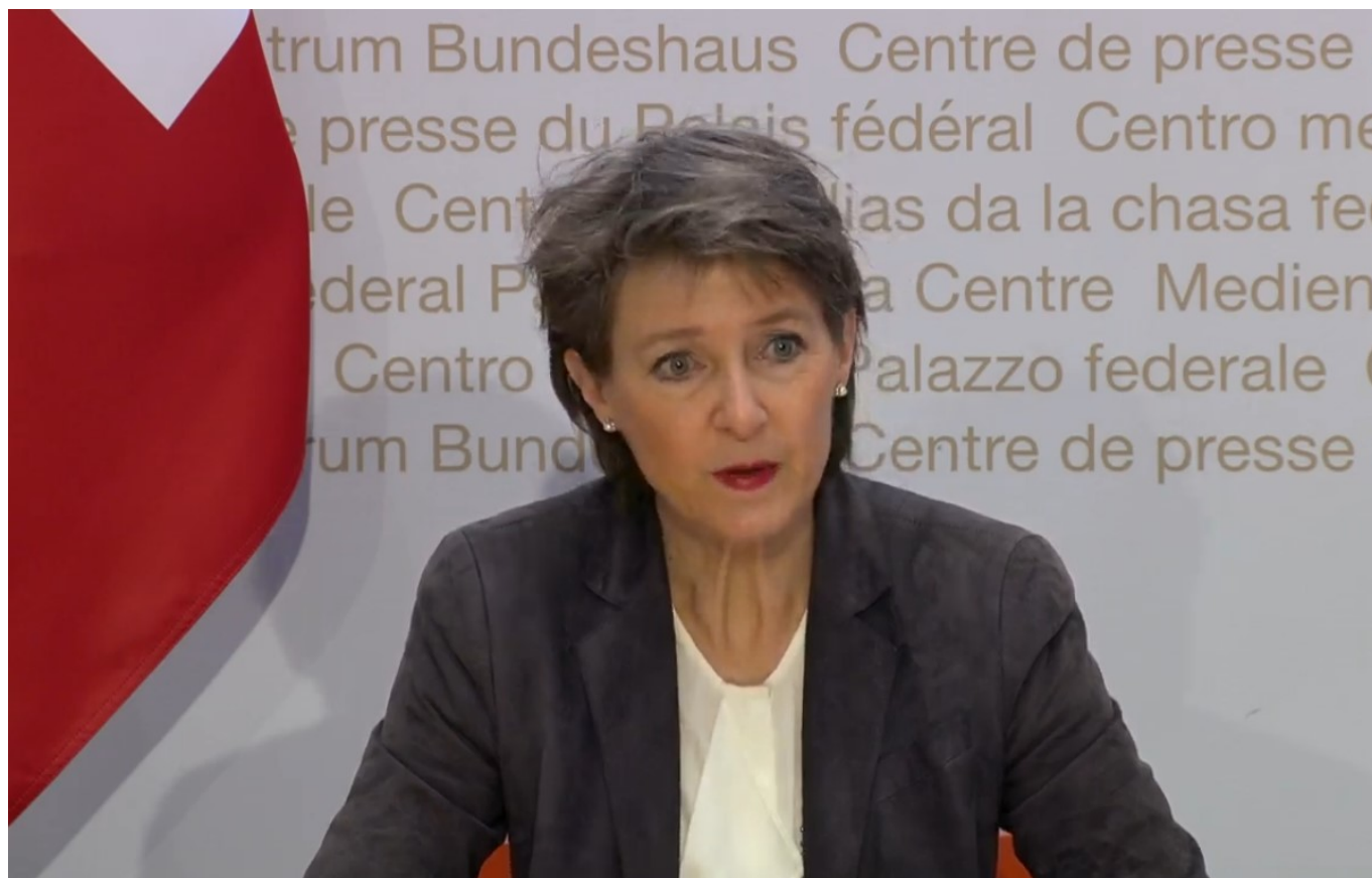
Президент Конфедерации Симонетта Соммаруга. Скриншот трансляции брифинга от 18 декабря

Федеральный совет продлевает срок действия упрощенной процедуры перехода на сокращенный рабочий день до 31 марта 2021 года. Правительство также планирует предоставить помощь людям с низкими доходами, в частности, те, кто зарабатывает до 3470 франков в месяц, получают 100%-ю компенсацию в случае перехода на неполную занятость. Правила применяются ретроактивно с 1 декабря 2020 года. В настоящее время проводятся консультации по дальнейшим мерам.