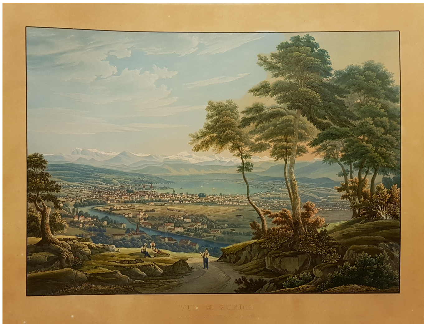
Цюрих. Гравюра, раскрашенная гуашью, 19 в.

Ценность Женевы в глазах Герцена состояла в том, что она оставалась центром европейской демократической эмиграции и, начиная с 1860-х годов, все больше становилась прибежищем русских революционеров и тех, кто позднее вольется в их ряды. То есть превращалась в город, который впоследствии будут называть «колыбелью русской революции».