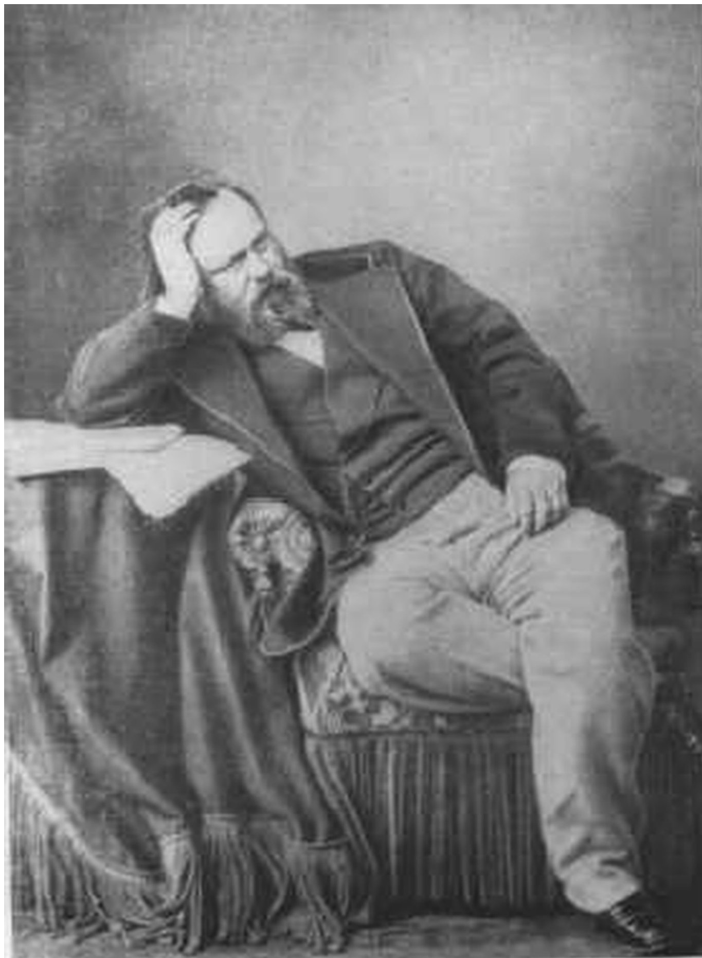
Александр Иванович Герцен. Лондон, 1861 г.