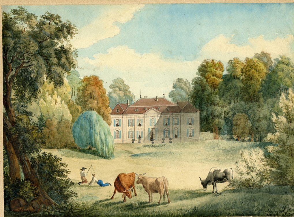
Boissière Route de Chêne (près Genève)

Зачем понадобился Герцену такой большой дом? Дело в том, что он вернулся в Женеву не один, а с новой спутницей жизни – Натальей Алексеевной Тучковой-Огаревой. Как вы помните, Герцен пережил трагический опыт вторжения в его семейную жизнь Георга Гервега. Правда, Гервегу не удалось разрушить семью Герцена. Зато в Лондоне сам Александр Иванович разбил семью своего ближайшего друга и соратника Николая Огарева. В 1857 году Наталья Алексеевна стала фактической женой Герцена. При этом, как и в истории с «Гнездом близнецов», все продолжали жить под одной крышей. С той разницей, что Огарев с самого начала был в курсе сближения его жены с другом. Он тяжело переживал ситуацию, начал злоупотреблять алкоголем.