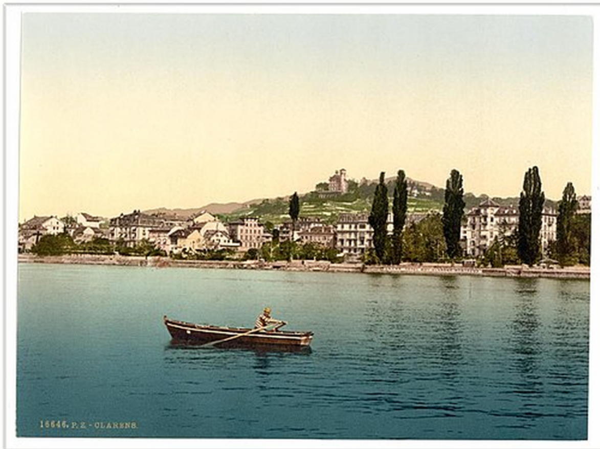
Кларан. Здесь остановился Лев Толстой в 1857 году. Старинная фотография

Казалось бы, классический пример реакции на красоту швейцарской природы. Но простой констатацией Толстой не ограничивается, он всегда и во всем находит повод для размышлений, философских обобщений. Это видно, когда мы читаем его «Путевые записки по Швейцарии», в частности, отрывок, посвященный пребыванию Толстого все в том же Кларане.