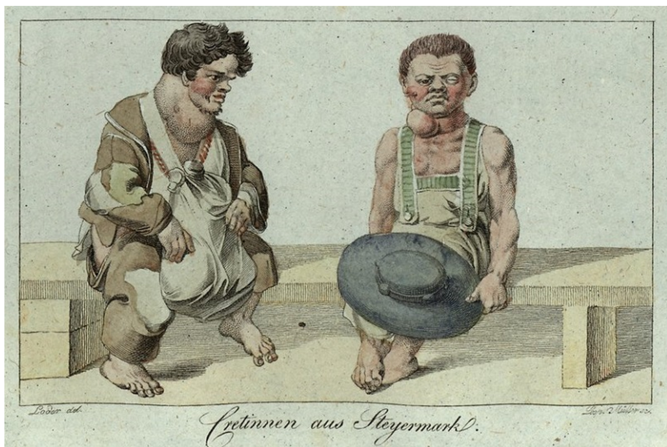
Люди, страдающие кретинизмом. Старинная гравюра

Имеется немало свидетельств того, что заболевание было распространено в Швейцарии издавна. Об этом говорят даже произведения искусства, например, фреска «Тайная вечеря» неизвестного художника XV века в церкви Сан-Мартино в местечке Дитто ди Кунасco в Тичино (Chiesa di San Martino, Ditto di Cugnasco, Canton Ticino). Иуда Искариот изображен с зобом и другими явными признаками слабоумия. Уточню, что зоб, как правило, является ярким симптомом эндемического (то есть местного, свойственного данной местности) кретинизма, вызванного дегенеративными изменениями щитовидной железы. Очевидно, что художник знал о связи зоба и слабоумия и не случайно представил именно этот персонаж кретином, желая подчеркнуть его негативный характер. Кстати, полагают, что слово «кретин» ввел в медицину в начале семнадцатого века также швейцарец – знаменитый врач, естествоиспытатель и писатель Феликс Платтер.