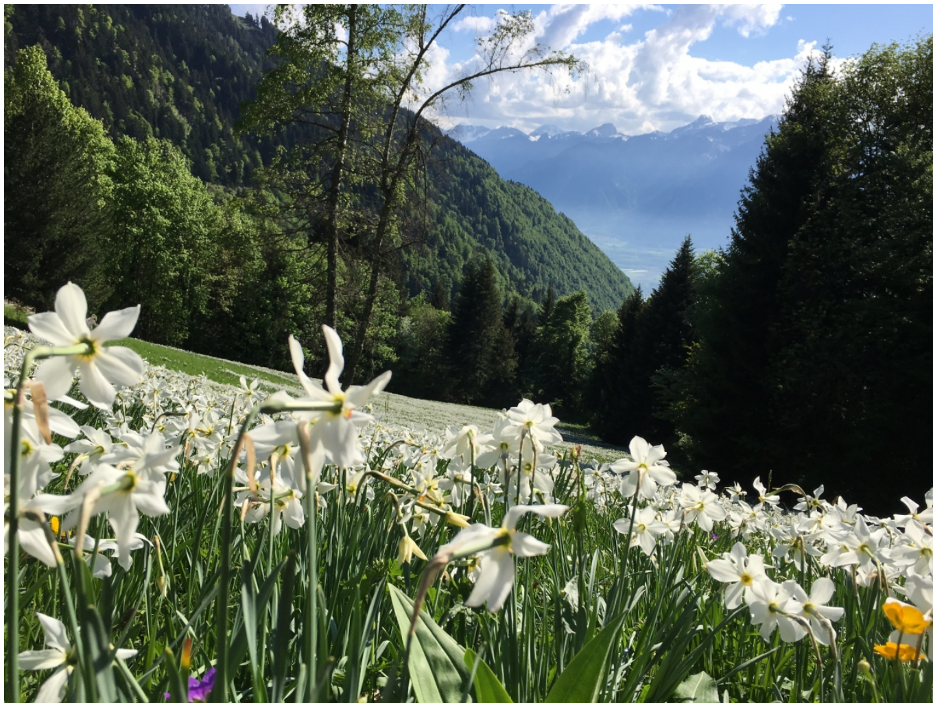
Поля нарциссов в районе Лез-Аван - «скверные луга для скотины».

Далее писатель признается, что не смог найти ответ на это вопрос и предпочел остаться в состоянии неопределенности, колебания, поскольку только это – «единственное справедливое жизненное чувство». В дальнейшем в произведениях Толстого мы никогда не увидим однозначной оценки событий или людей, мы не встретим стопроцентных негодяев или безупречных героев. А его главные персонажи, вечно раздираемые противоречиями, ищущие и не находящие однозначных решений, будут, как и сам автор, «довольствоваться гармоническим колебанием», классический пример тому Пьер Безухов.