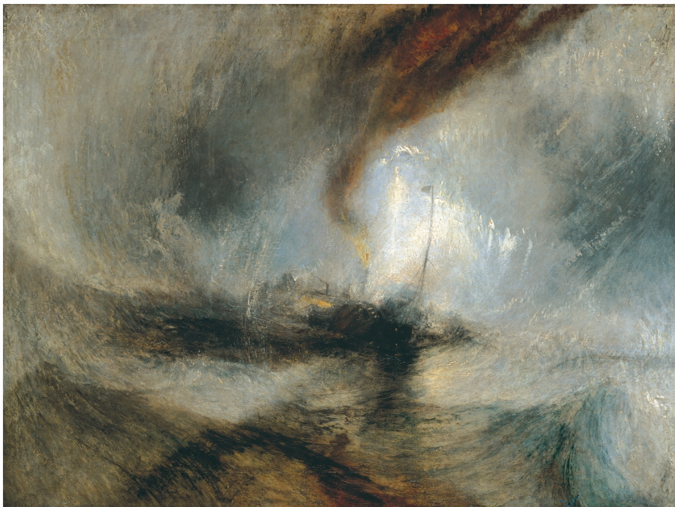
Д. М. У. Тернер. Снежная буря, 1842 г. (с) The Tate Gallery, London

Старая добрая Англия открыла окно в новый мир, новую эпоху. На картине осталось место лодке, зрителям, пахарю и даже зайцу, но что все они в сравнении с этим несущимся, будто сорвавшимся с цепи временем, с белыми сгустками мазков не успевающего рассеяться пара?! Заяц и пейзаж в стиле Брейгеля уступают место поезду, двигателю, Тернеру.