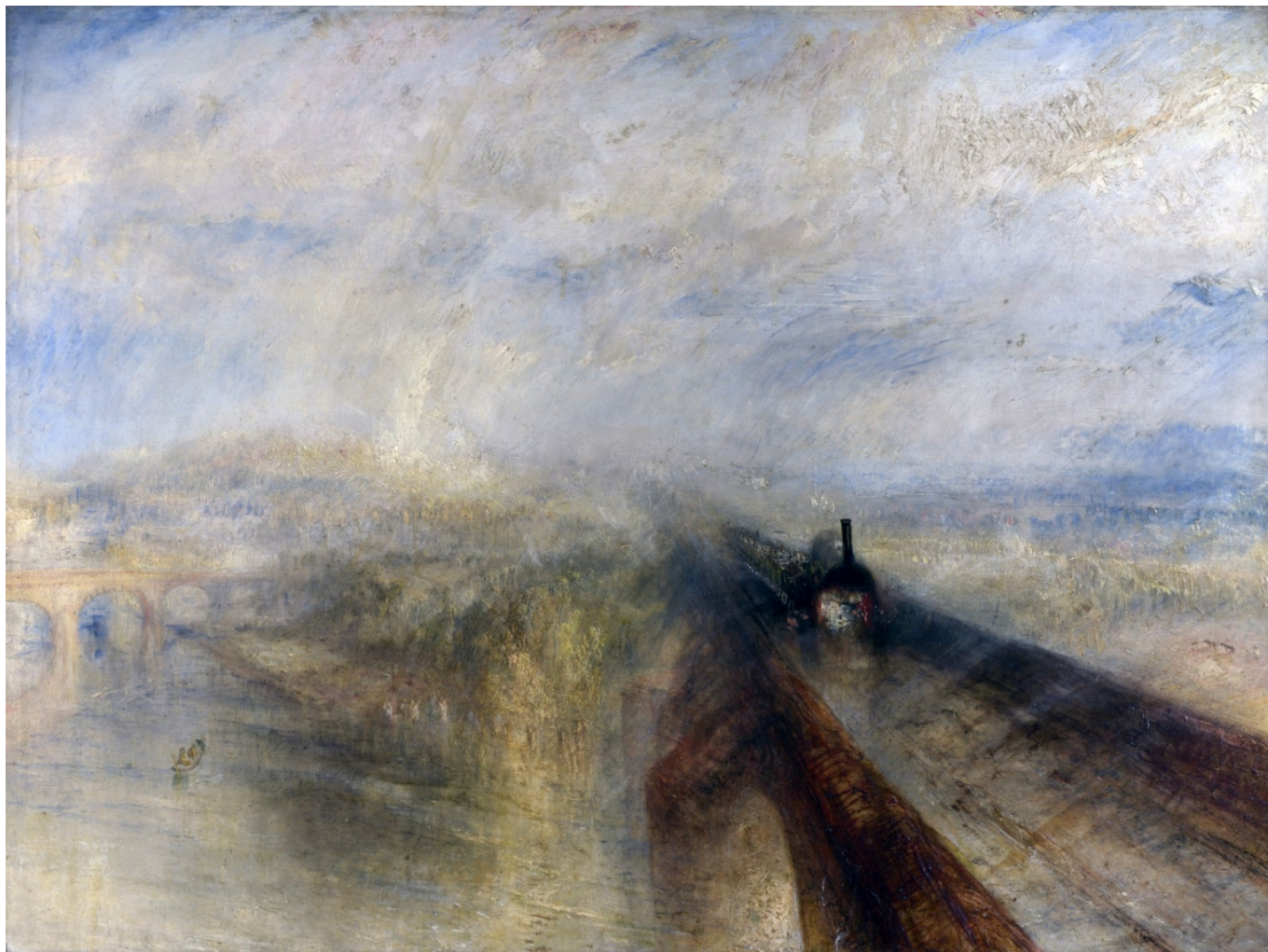
Д. М. У. Тернер. Дождь, пар и скорость, 1844 г.

Умер Уильям Тернер 19 декабря 1851 года в Лондоне. Согласно его завещанию, всё собрание его произведений перешло британской нации и ныне экспонируется в лондонской галерее Тейт, а бренное тело художника похоронено у собора Святого Павла. Именем «старого брюзги» названа была одна из самых престижных премий в области современного изобразительного искусства, учрежденная в 1984 году. Единственное условие к ее соискателям: в течение года перед вручением премии надо показывать свои работы в Великобритании. Подготовленная публика ждет от жюри выбора в пользу наиболее скандального из претендентов.