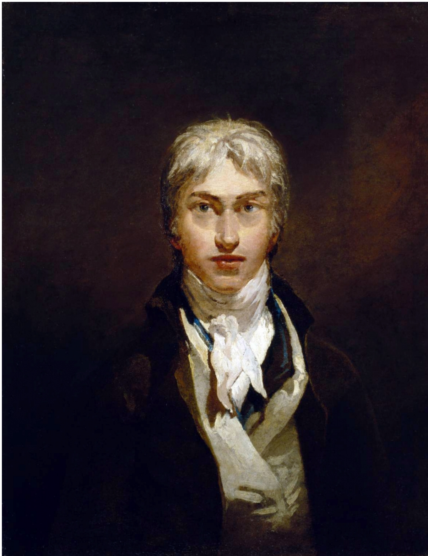
Д. М. У. Тернер. Автопортрет, 1799 г.

За время длительного пребывания в Италии в 1819 году Тернер открыл для себя интенсивные цвета, более «промытые и четкие» тона, а главное – невероятное, южное итальянское солнце. Были созданы огромные полотна, посвященные