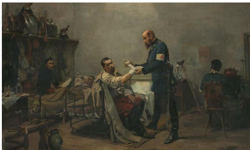
Эдуар Кастр, «Швейцарский полевой госпиталь в 1871 году», 1871 (© Ville de Genève, Musées d'art et d'histoire)

На сайте Женевского Музея искусства и истории ( МАН ) можно оценить оцифрованные коллекции шедевров; советуем обратить внимание на подборку картин , авторы которых воздали должное врачам, изобразив их за работой или написав их портреты. Кроме того, в период вынужденного пребывания дома музей готов преподнести вам оригинальный подарок. Для этого нужно сфотографировать одну из комнат своей квартиры или дома, выбрать на сайте музея экспонат, который вы хотели бы увидеть в родных пенатах, и отправить снимок вместе со ссылкой на произведение искусства на адрес community.mah@ville-ge.ch . В письме укажите свое имя, сферу деятельности или интересов, эксперты МАН поместят картину, скульптуру или другой предмет в вашу гостиную так, будто она действительно там находится. Также на фото появятся несколько ссылок на видео, фото и аудиозаписи, связанные с выбранным вами экспонатом. Снимок будет размещен на этом сайте , откуда им легко поделиться в социальных сетях или отправить друзьям по почте.