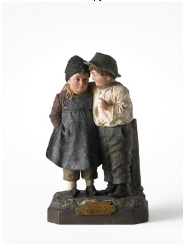
Иоганн Мареш, «Двое ребят» 1880 – 1900

На сайте Лозаннского кантонального музея изобразительных искусств (МСВА) каждый понедельник публикуются творческие задания для детей и родителей. Из пояснений можно узнать много интересного, например: в 1834 году американский промышленник нанял швейцарского художника Шарля Глейра для документирования в рисунках его путешествия. Вместе они посетили Сицилию, Мальту, Грецию, Малую Азию, Египет и Судан; Шарль Глейр запечатлел на бумаге экзотические интерьеры, живописные пейзажи и величественные памятники архитектуры. Связанное с этой историей задание состоит в том, чтобы оценить свое повседневное окружение взглядом художника и выбрать три сюжета: одного из своих близких за его привычным занятием, предмет из вашего интерьера, а также вид на комнату или на пространство, открывающееся за окном. После этого останется только нарисовать, результат творческого процесса можно разместить на странице МСВА в Facebook или отправить в музей по эл. почте mcbactivites@gmail.com .