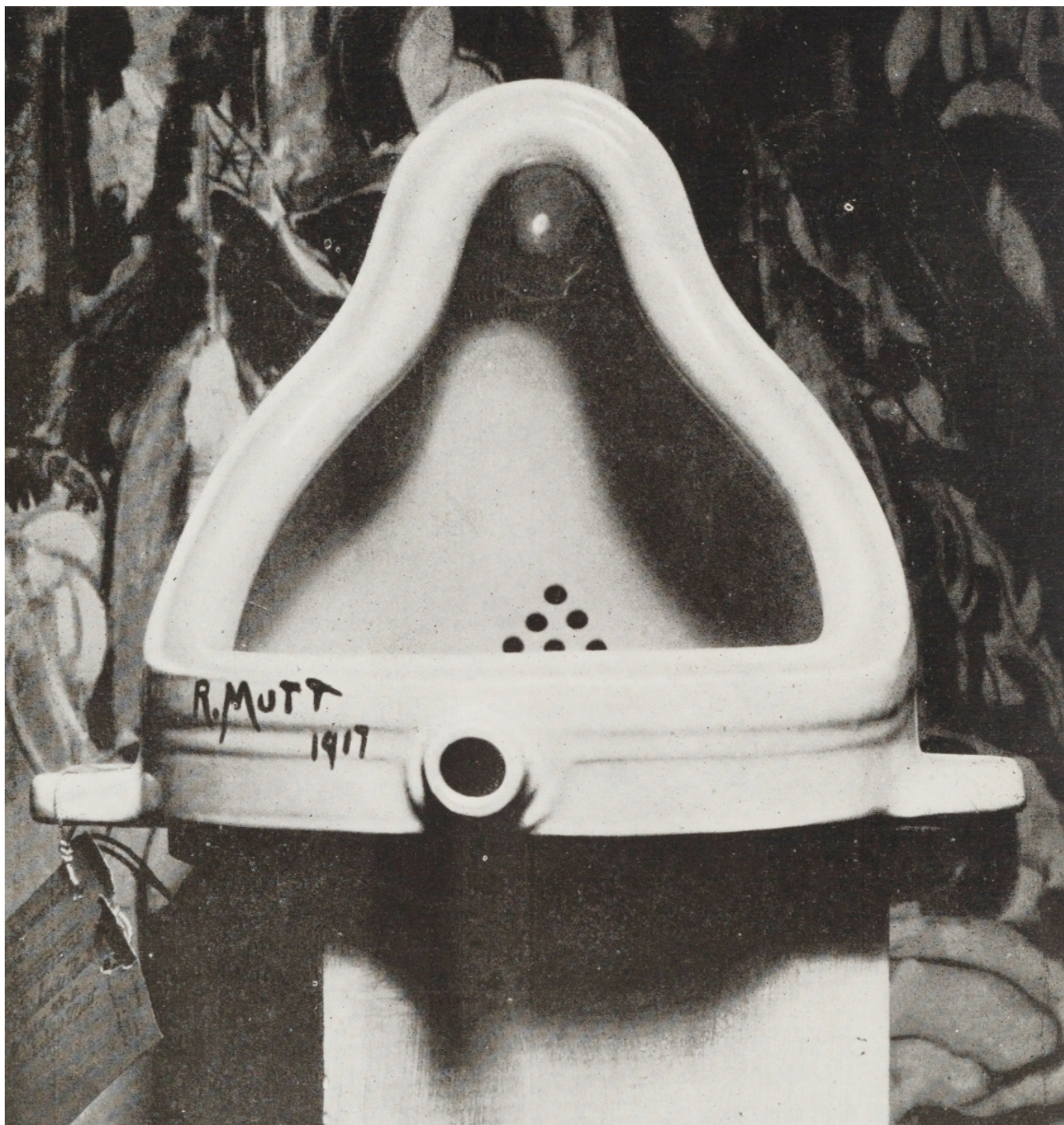
Фотография оригинала работы Дюшана, сделанная Альфредом Стиглицем в 1917 году на фоне картины Хартли Марсдена "Войны"

Возмущенный Дюшан отнес писсуар в ателье знаменитого фотографа Альфреда Стиглица, сфотографировался с «Фонтаном» сам и отдельно сфотографировал «объект», но в перевернутом состоянии, подчеркнув, что его новое положение в пространстве означает, что с этого момента писсуар перестал быть писсуаром, а стал всем, чем угодно, что кому в голову придет: Дарумой в платке, фигурой Богоматери с младенцем, сидящим Буддой.