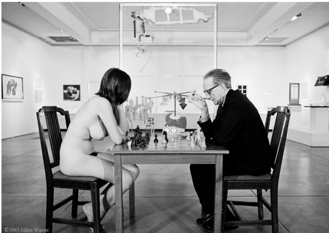
Дюшан, играющий с обнаженной в шахматы. Фотография сделана фотографом журнала Time Джулианом Вассером в 1963 году, в Пасадене

Никому из поклонников Дюшана среди его современников не сообщали, конечно, что «Фонтан» 1917 года был выброшен самим художником, а «Велосипедное колесо» (1913 г.) – один из первых его «реди-мейдов», было выставлено на помойку одной из его сестер во время уборки парижской квартиры.