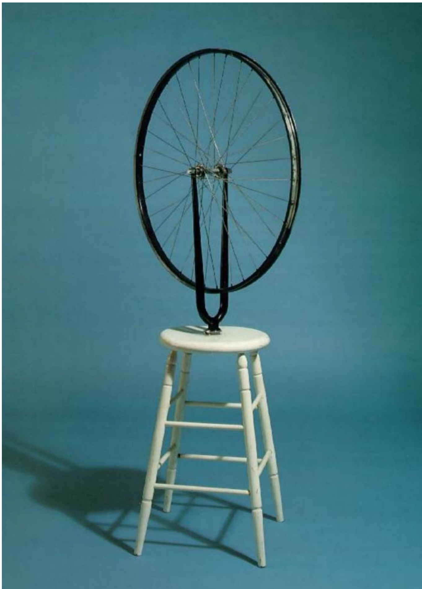
Марсель Дюшан. "Велосипедное колесо" (1913)