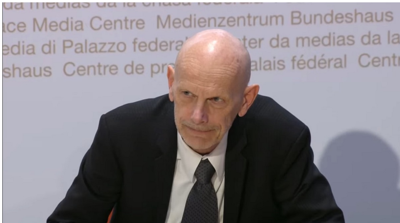
Даниэль Кох. Скриншот видеотрансляции брифинга от 28 марта

Отделения реанимации и интенсивной терапии в Швейцарии пока не перегружены. Более того, швейцарские госпитали приходят на помощь французским. Так, на днях в Женевский университетский госпиталь (HUG) на вертолете были доставлены два пациента из французского города Мюлуз, а в кантональную больницу Аргау перевезли двух больных из Кольмара. В общей сложности медицинские учреждения кантонов Женева, Невшатель, Фрибург, Во, Аргау, Юра, Берн, Базель-сельский и Базель-городской примут более 20 французских пациентов.