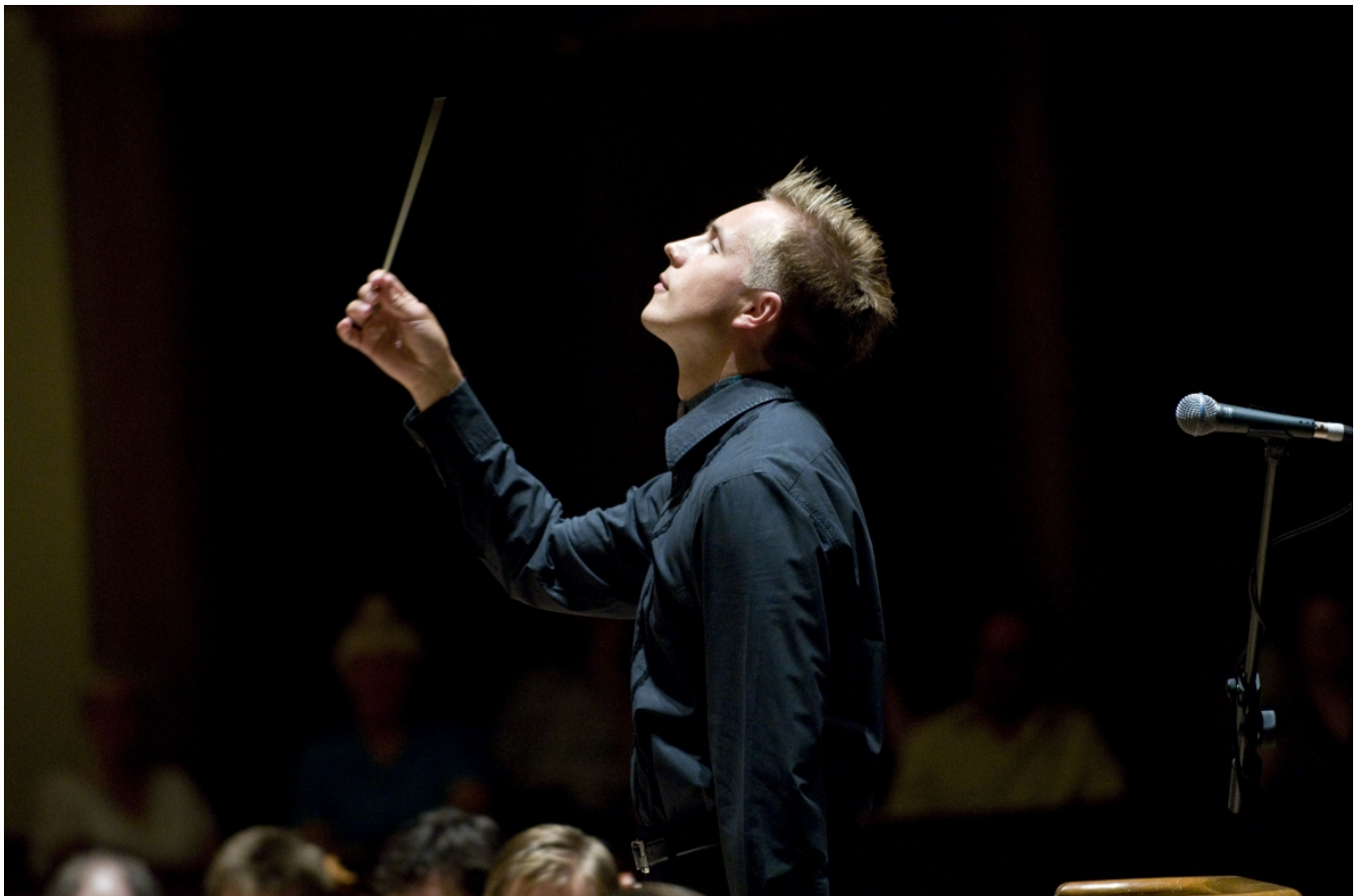
Василий Петренко Vassily Petrenko

Три дирижера – россиянин Василий Петренко, австриец Манфред Хонек и испанец Хуанхо Мена – представят швейцарской публике свои интерпретации трех шедевров П. И. Чайковского – его Симфоний №№ 4, 5 и 6. В преддверии предстоящих концертов вот несколько выдержек из писем и записных книжек композитора, дающих четкое представление о том, в каком душевном состоянии он находился во время их создания и какие мысли и чувства стремился вложить в свою музыку.