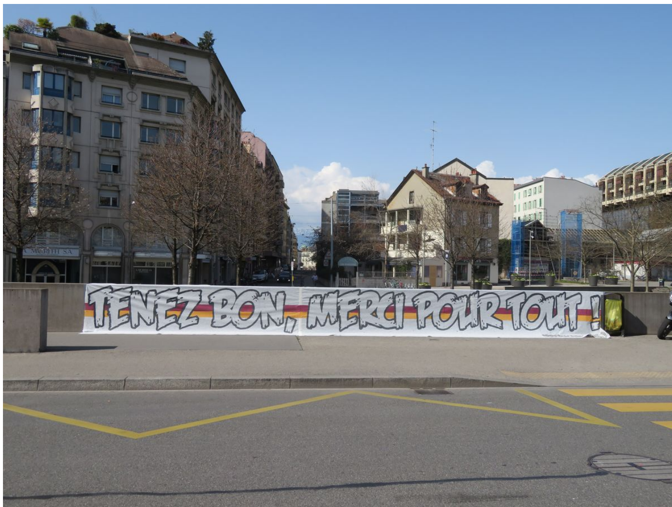
Благодарственная надпись перед входом в Женевский кантональный госпиталь