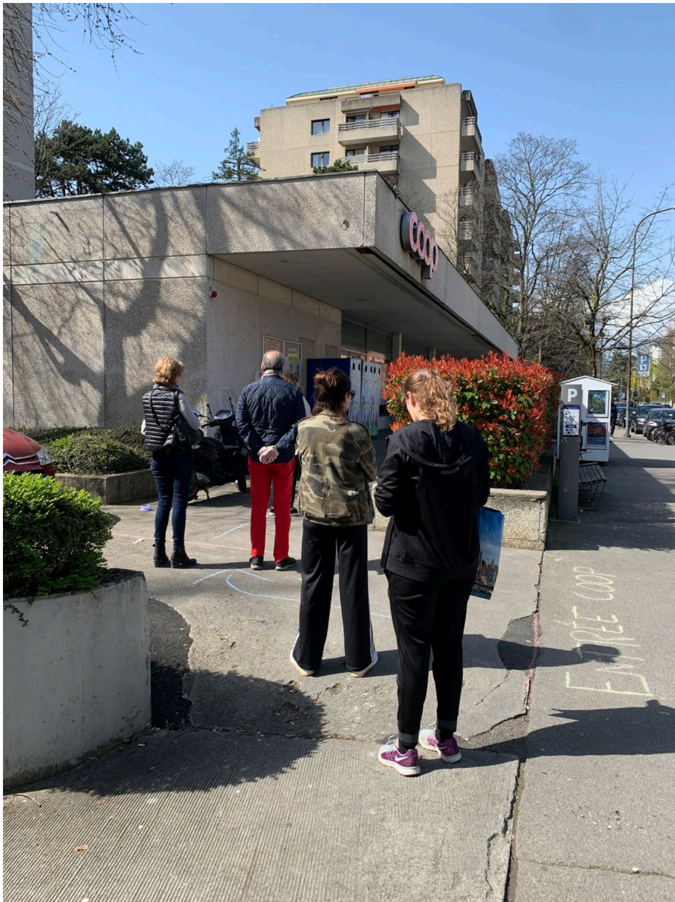
Дисциплинированная очередь перед входом в COOP

Помогают друг другу соседи. Во многих городах создаются волонтерские группы,