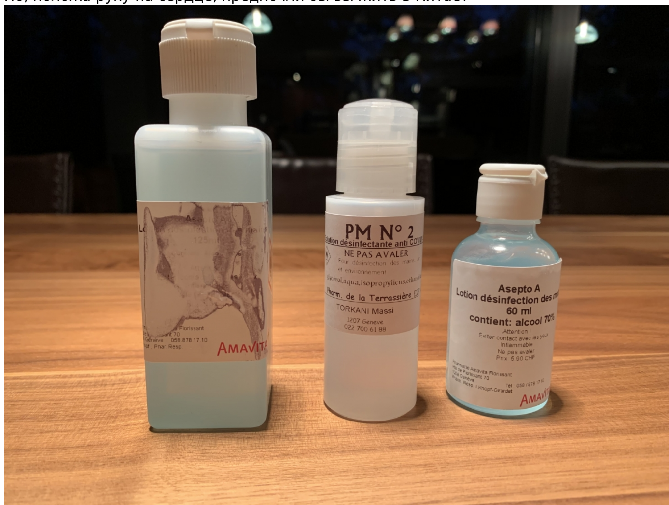
Такие разные пузырьки

Многие возмущаются, почему правительство не приняло более радикальных мер, например, не объявило тотальный карантин. В демократической стране сделать это сложнее, чем при тоталитарном режиме. Не исключено, однако, что все к этому идет. Но, положив руку на сердце, предпочли бы вы жить в Китае?