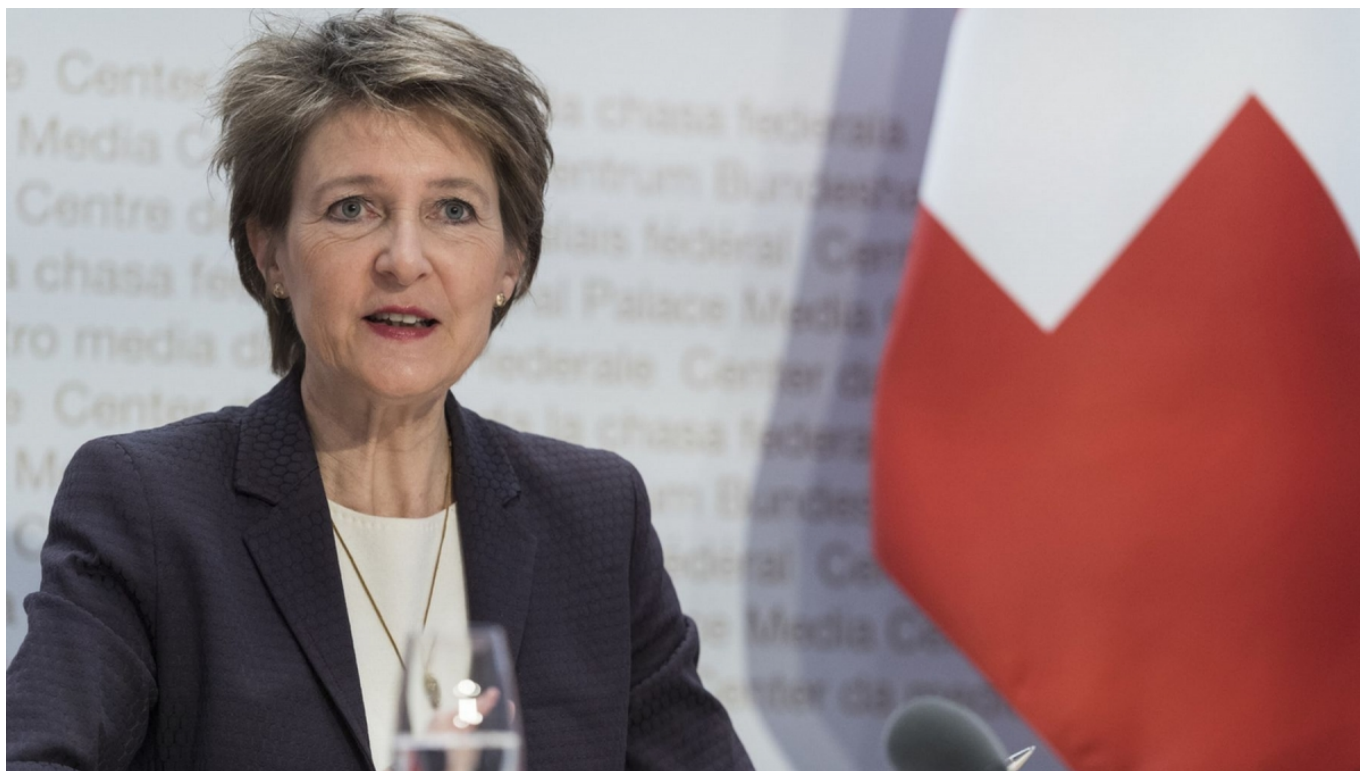
Президент Швейцарии Симонетта обратилась к нации