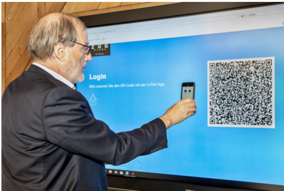
Мэр Цуга отдает свой голос с помощью блокчейна

«Децентрализованное электронное голосование гарантирует максимальную защиту данных и прозрачность, так как позволяет проследить за каждым голосом», - сказал он тогда журналистам. При использовании блокчейна невозможно осуществить какие-либо манипуляции с отданными голосами, как это бывает в странах с несовершенной демократией.