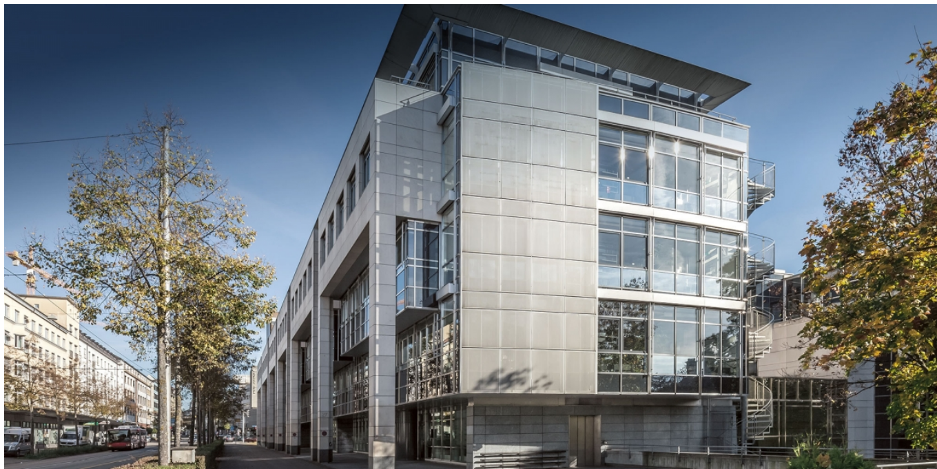
Орган надзора за финансовыми рынками Швейцарии (FINMA)

Параллельно с выдачей лицензий FINMA сочла нужным выпустить разъяснения насчет того, каким образом к таким организациям применяется швейцарское законодательство против отмывания денег. Согласно этому документу, финансовым структурам нового типа разрешено высылать и получать криптовалюты или токены только от клиентов, личность которых установлена. По мнению регулятора, анонимность и быстрота транзакций в блокчейне кроме удобства несут угрозу увеличения масштабов отмывания денег и спонсирования терроризма. К тому же, потеря прибыли от транзакций может заставить банки принимать больше клиентов из развивающихся стран с высокими рисками.