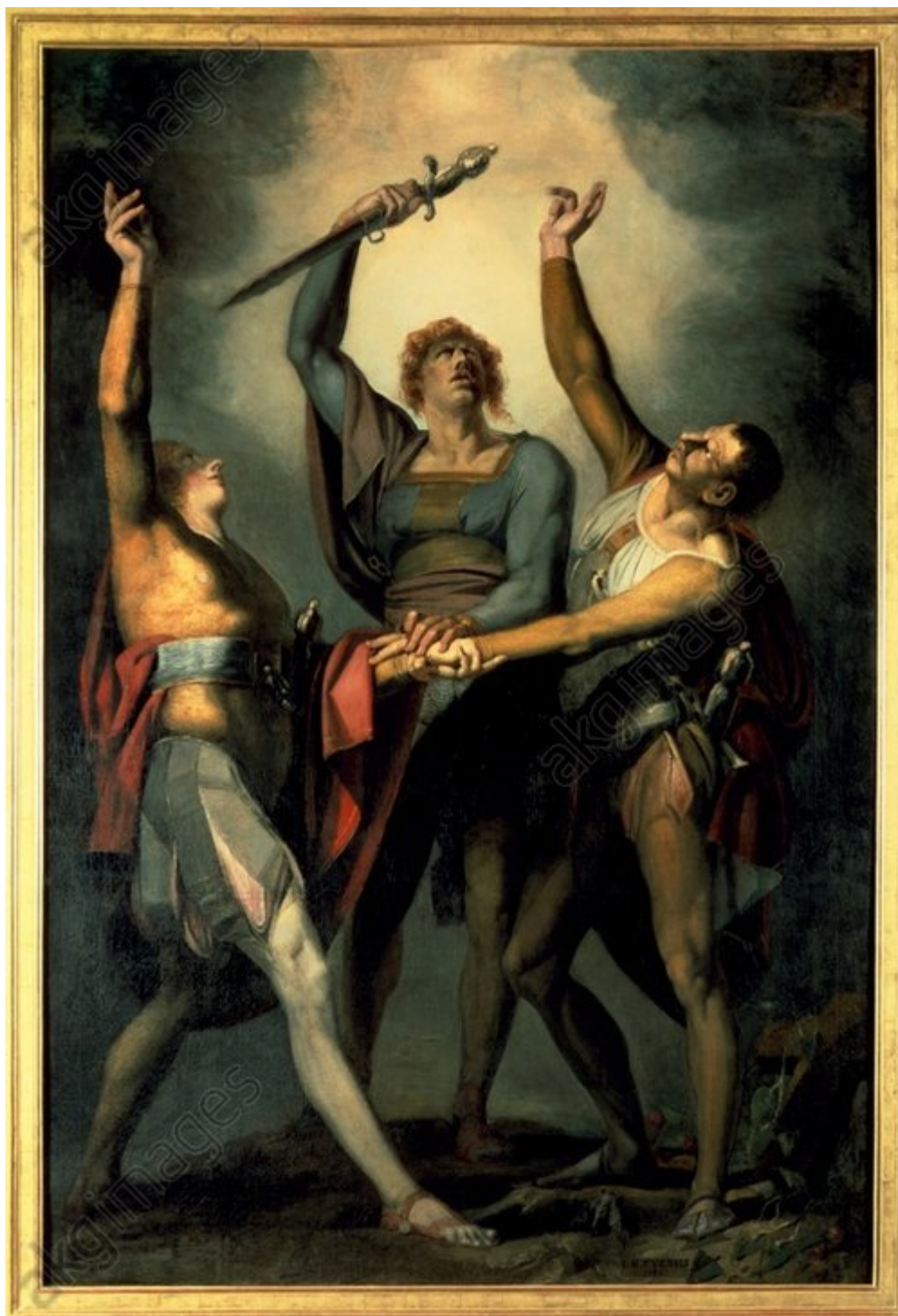
И. Г. Фюссли. Клятва на лугу Рютли, 1780 г.

Интересный факт: когда в 1843 году поэт и переводчик Фёдор Миллер опубликовал свою версию «Вильгельма Телля», другой Тургенев, знаменитый русский писатель Иван Сергеевич, написал статью, в которой этот перевод раскритиковал, а заодно изложил, свое отношение к произведению немецкого поэта и свое понимание заложенных в нем идей.