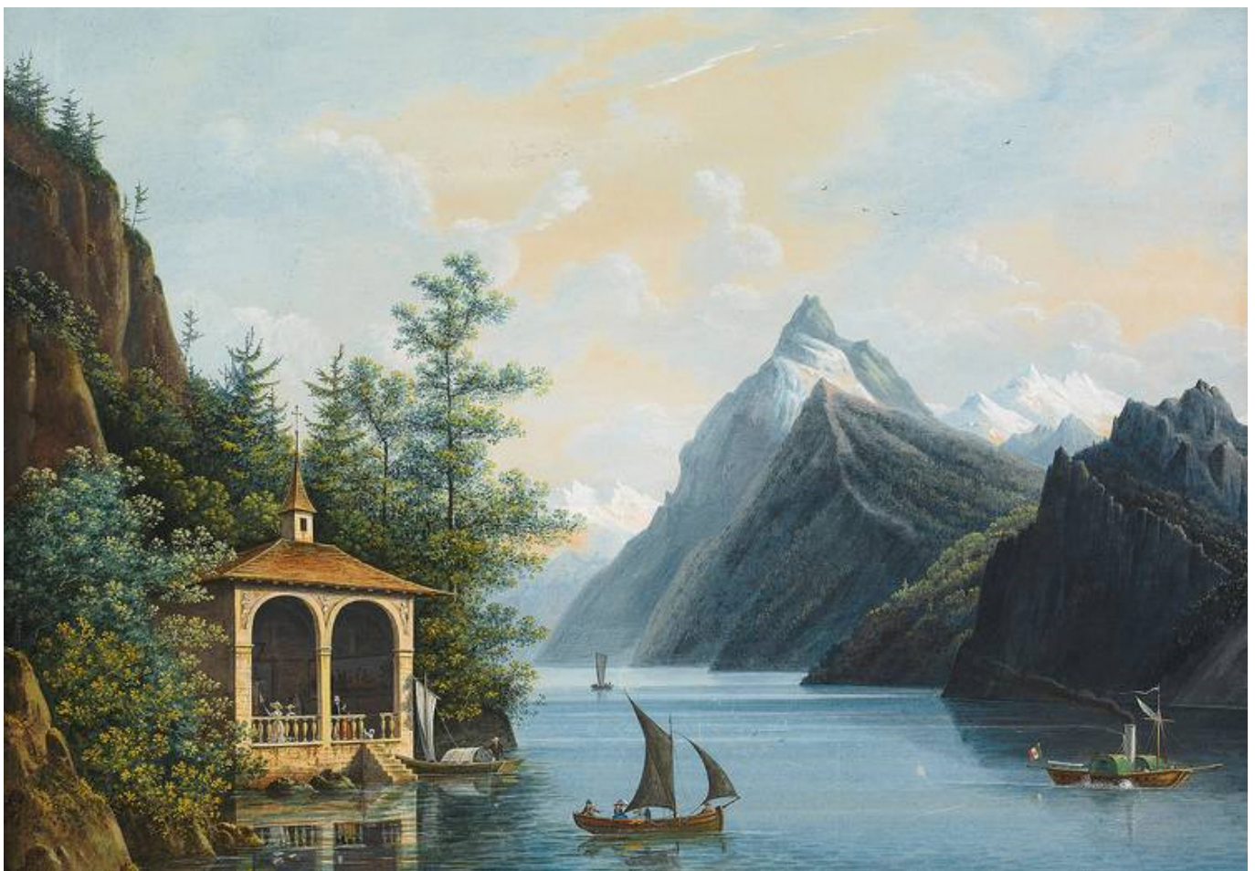
Часовня Вильгельма Телля. Гуашь. XIX век.

Автор: Наталья Беглова, Женева , 29.11.2019.