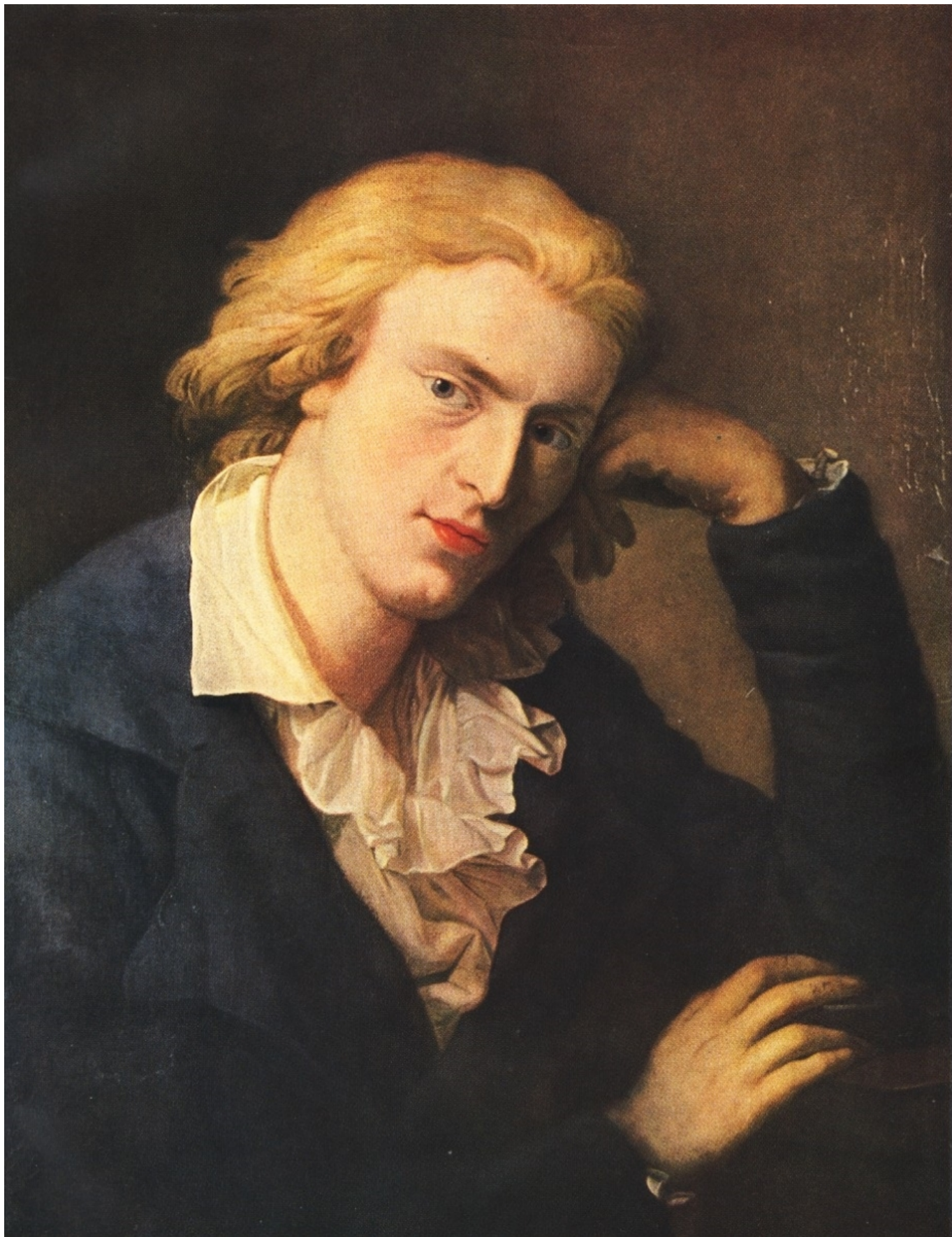
Антон Граф. Фридрих Шиллер. Холст, масло. 1790 г.

Фигуры Вильгельма Телля тоже продолжает вызывать живой интерес. Многие исследователи полагают, что такого человека вообще не существовало, а все, связанное с его именем, – легенда, каких немало в фольклоре и других стран. Как бы