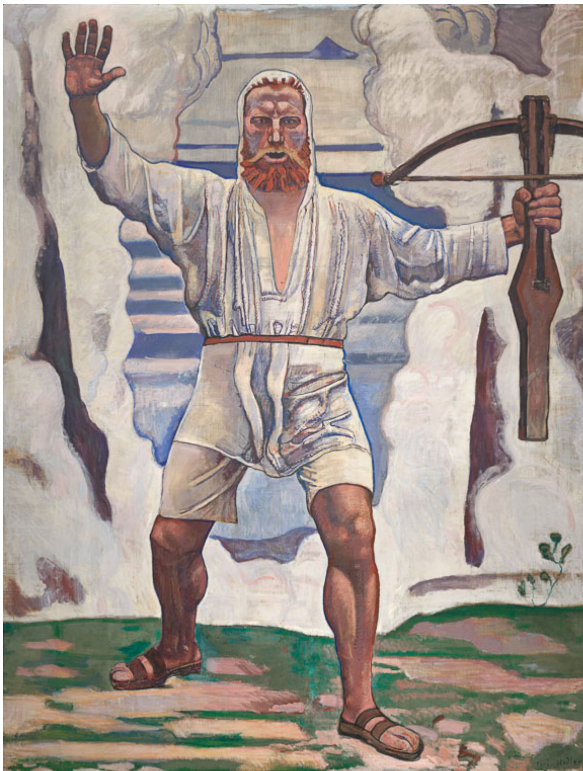
Фердинанд Ходлер. Вильгельм Телль. Холст, масло. 1897 г.

Пьеса «Вильгельм Телль» была поставлена в 1804 году в театре Веймара, и у Швейцарии появился новый образ – страны, где живут свободолюбивые люди, сумевшие избавиться от чужеземных завоевателей. Если раньше, говоря о Швейцарии, воспевали трудолюбие и добронравие ее жителей, теперь к этим качествам стали непременно добавлять патриотизм, смелость, отвагу.