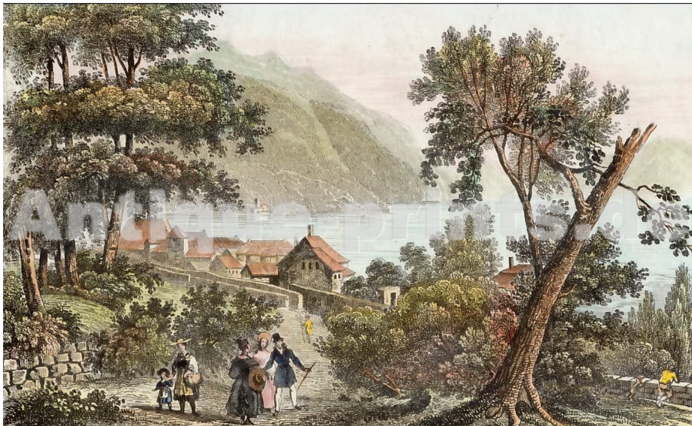
Э. Руарг. Кларан. Гравюра, раскрашенная акварелью, 1838 г.

«В простоте жизни пастухов и земледельцев есть что-то трогательное, – читаем мы в романе «Юлия, или Новая Элоиза». – Стоит поглядеть на луга, усеянные поселянами, которые ворошат сено, оглашая воздух песнями, посмотреть на стада, пасущиеся вдалеке, и невольно почувствуешь умиление, – а почему, и сам не знаешь. Так иногда голос природы смягчает наши черствые сердца и, хотя порождает в душе нашей лишь бесплодное сожаление, зов природы так сладок, что невозможно слушать его без наслаждения.