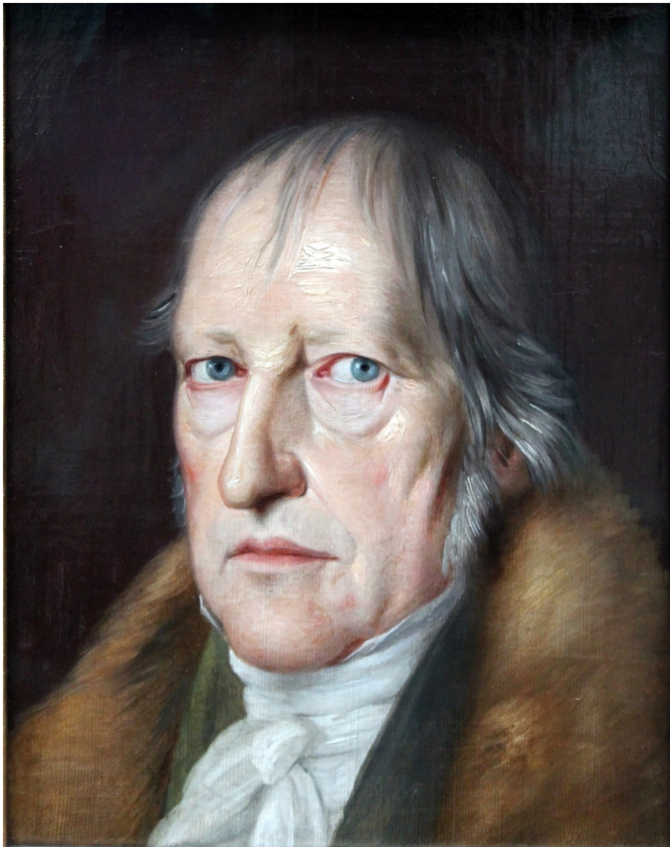
Якоб Шлезингер. Портрет философа Г. Ф. В. Гегеля, 1831 г. Таким Гегеля знают все, но было же и ему, как Онегину, 26 лет...

Путешествие по Бернским Альпам дает Гегелю уникальный повод для анализа взаимоотношений человека и окружающего мира. И его выводы отнюдь не совпадают с выводами Руссо. Как мы помним, для Руссо человек должен жить именно