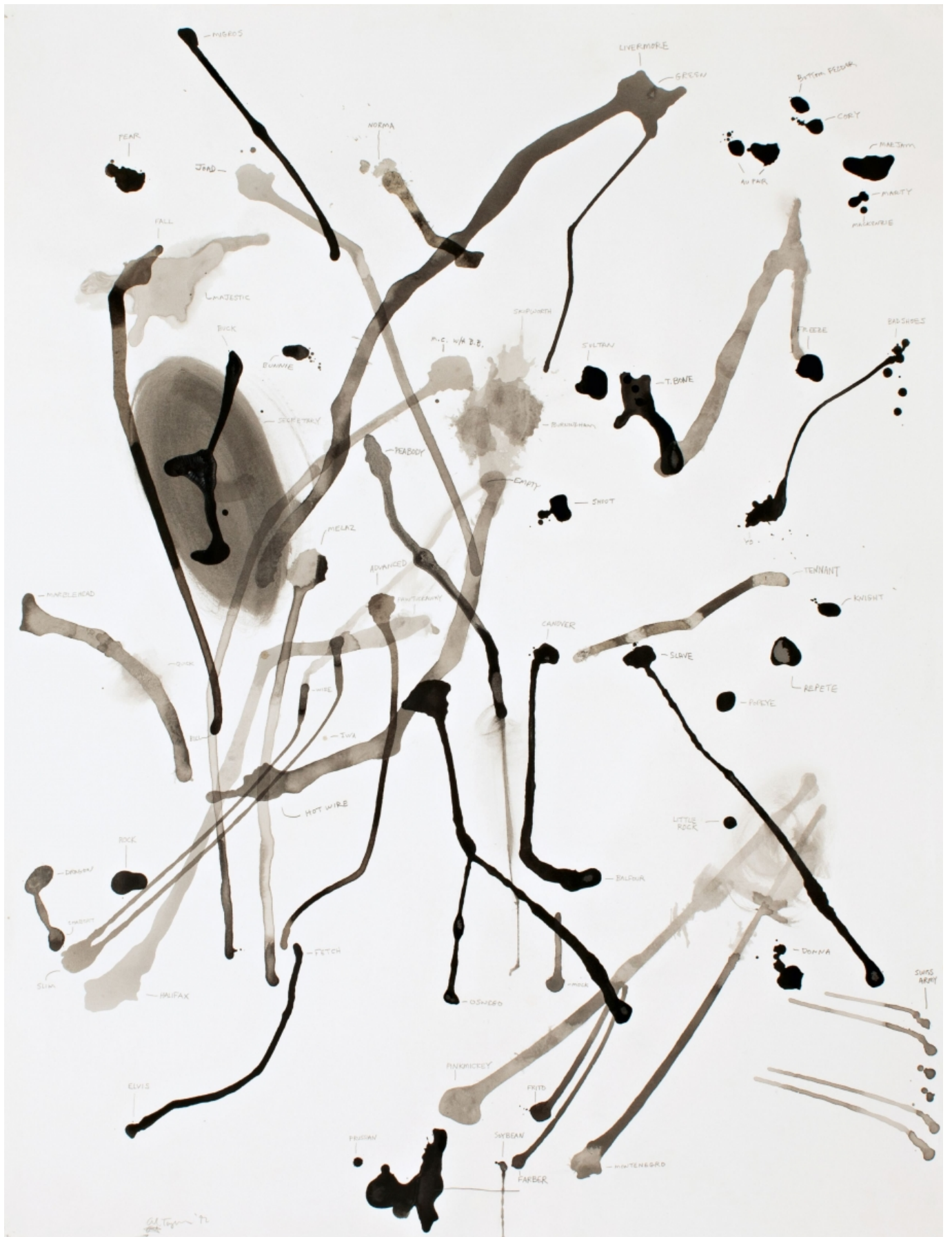
Эл Тэйлор. The Peabody Group N 8, 1992 (c) Collection Hubert Looser / The Estate of Al Taylor