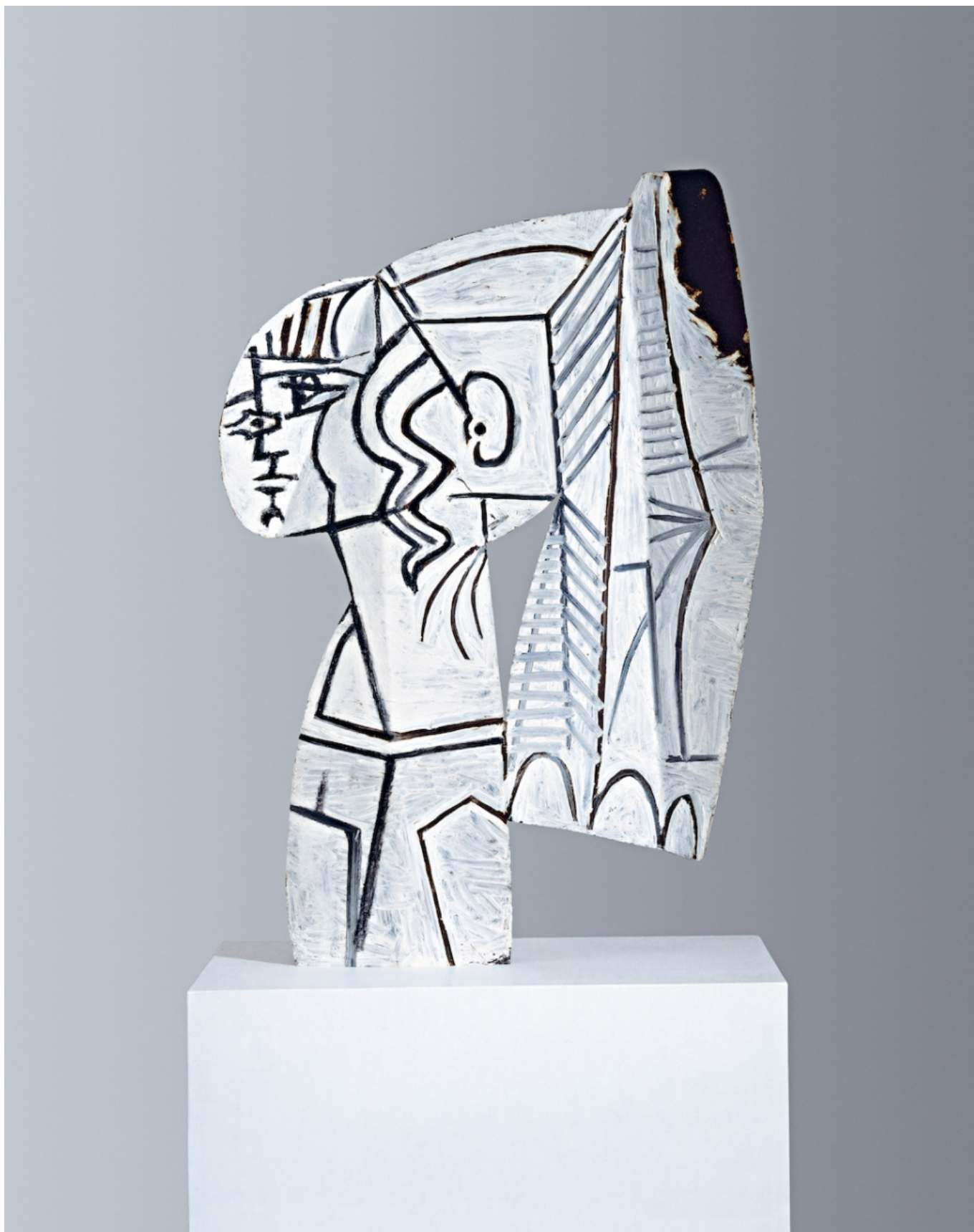
Пабло Пикассо. "Сильветта", 1954 г.

Знаменитая скульптура Пабло Пикассо 1954 года «Сильветта» возвращает нас в Европу. Эта конструкция из резного и крашеного масляной краской листового железа представляет собой «рисунок в пространстве». Игра с формой и материалом в