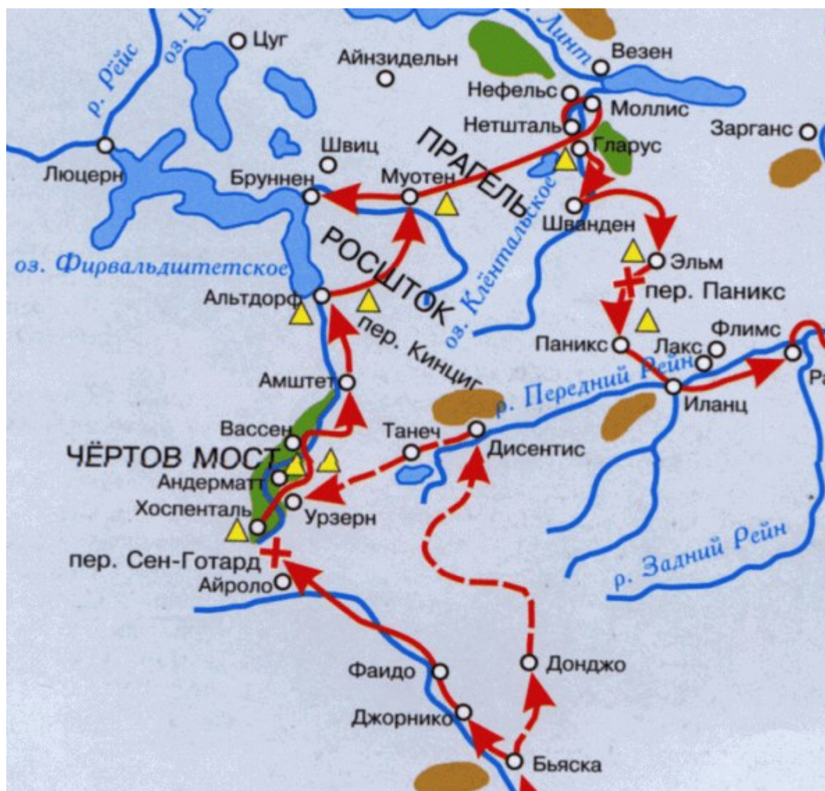
Карта Суворовского похода

Автор: Текст: (с) Владимир Орлов Айроло , 24.09.2019.