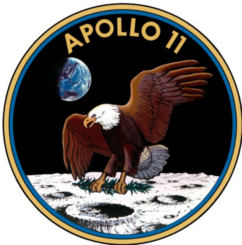
Эмблема миссии «Аполлон-11».

ограничивается. На космических костюмах астронавтов можно увидеть нашивки, в том числе американский флаг, эмблему Nasa и круглую эмблему миссии «Аполлон-11» с орланом, приземляющимся у лунного кратера с оливковой ветвью в лапах. В разработке дизайна участвовали сами астронавты: орлан отсылает к гербу США, а оливковая ветвь символизирует мирные намерения миссии.