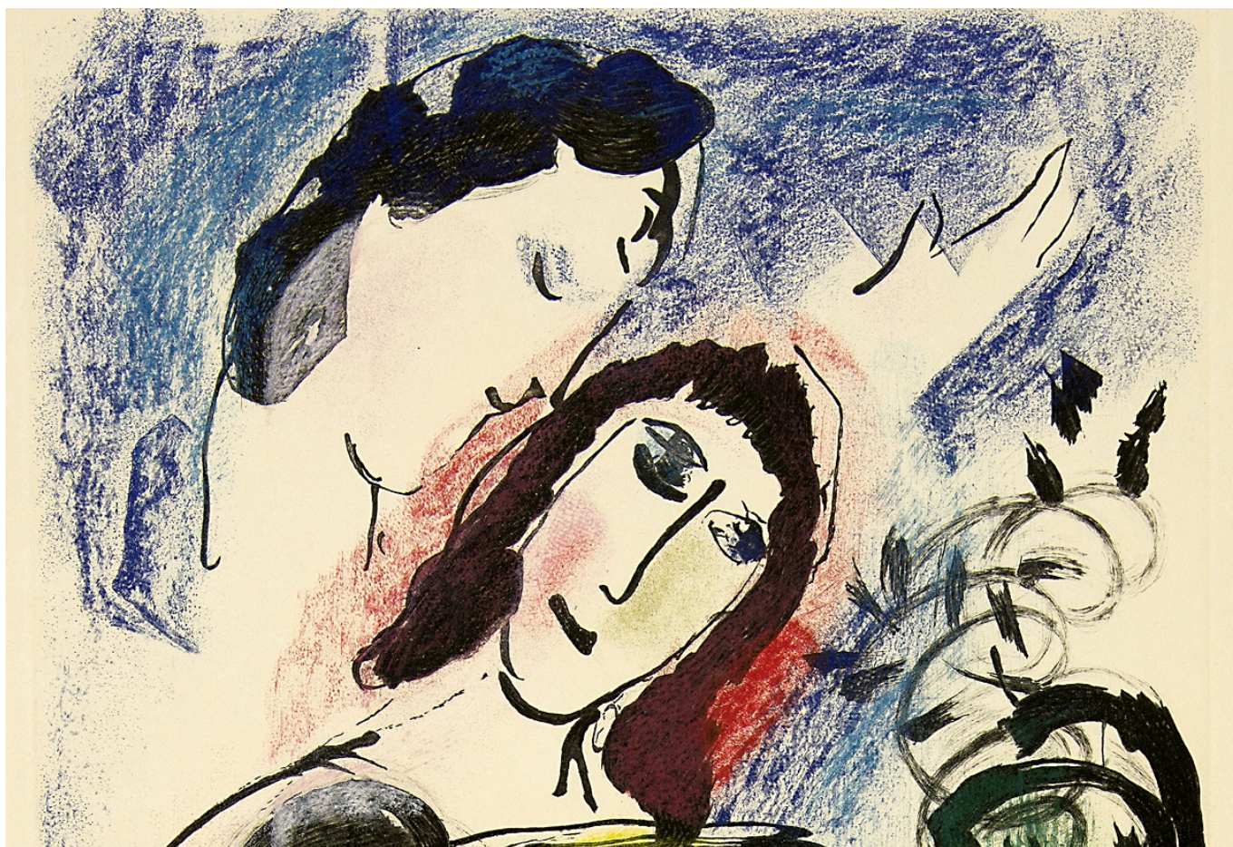
Марк Шагал. Желтый петух (фрагмент). Farbige Radierung, 1960. 45 x 28.5 cm. Sammlung EWK © 2019 ProLitteris, Zürich

Автор: Заррина Салимова, Шпиц , 28.06.2019.