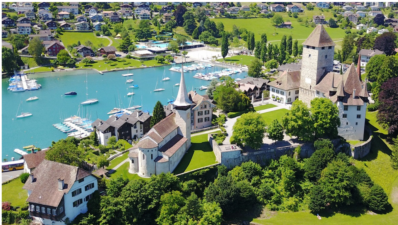
Шпиц – жемчужина Тунского озера.

человека, близко знавшие художника, поделятся своими воспоминаниями о нем.