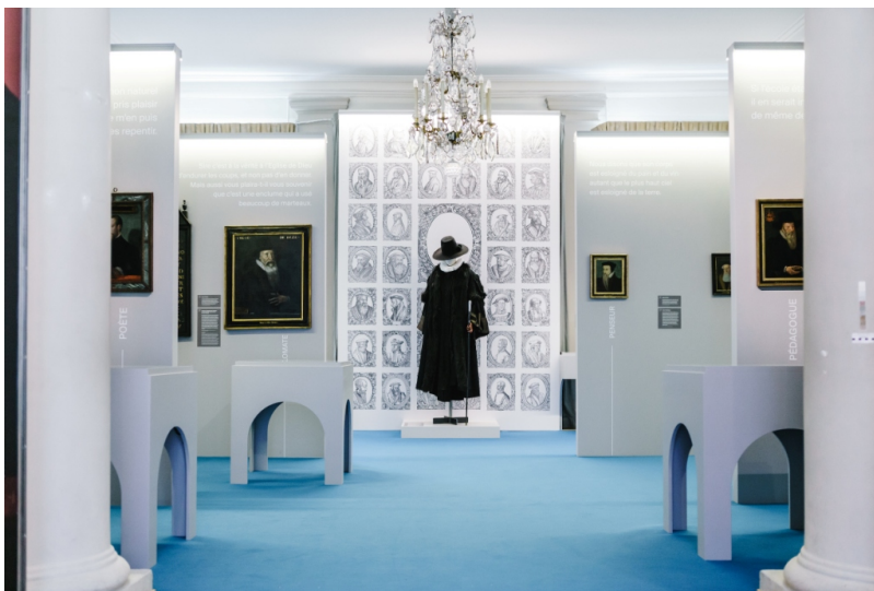
На выставке

Его талантом восхищался Монтень, его дружбы искала Екатерина Медичи, а король Франции Генрих IV побаивался его критики. Родившийся в Бургундии Теодор Беза выучил латинский и греческий языки под началом немецкого гуманиста Мельхиора Вольмара, который оказал значительное влияние на его идейное становление. Со временем стал играть видную роль в жизни своей страны, однажды ему довелось читать проповедь перед шестью тысячами человек в Париже.