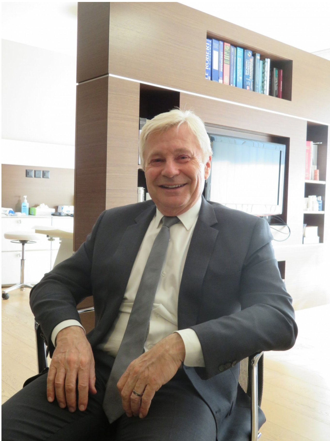
Профессор Жак Пруст

Для пациентов, дошедших до той критической черты, когда лишний вес