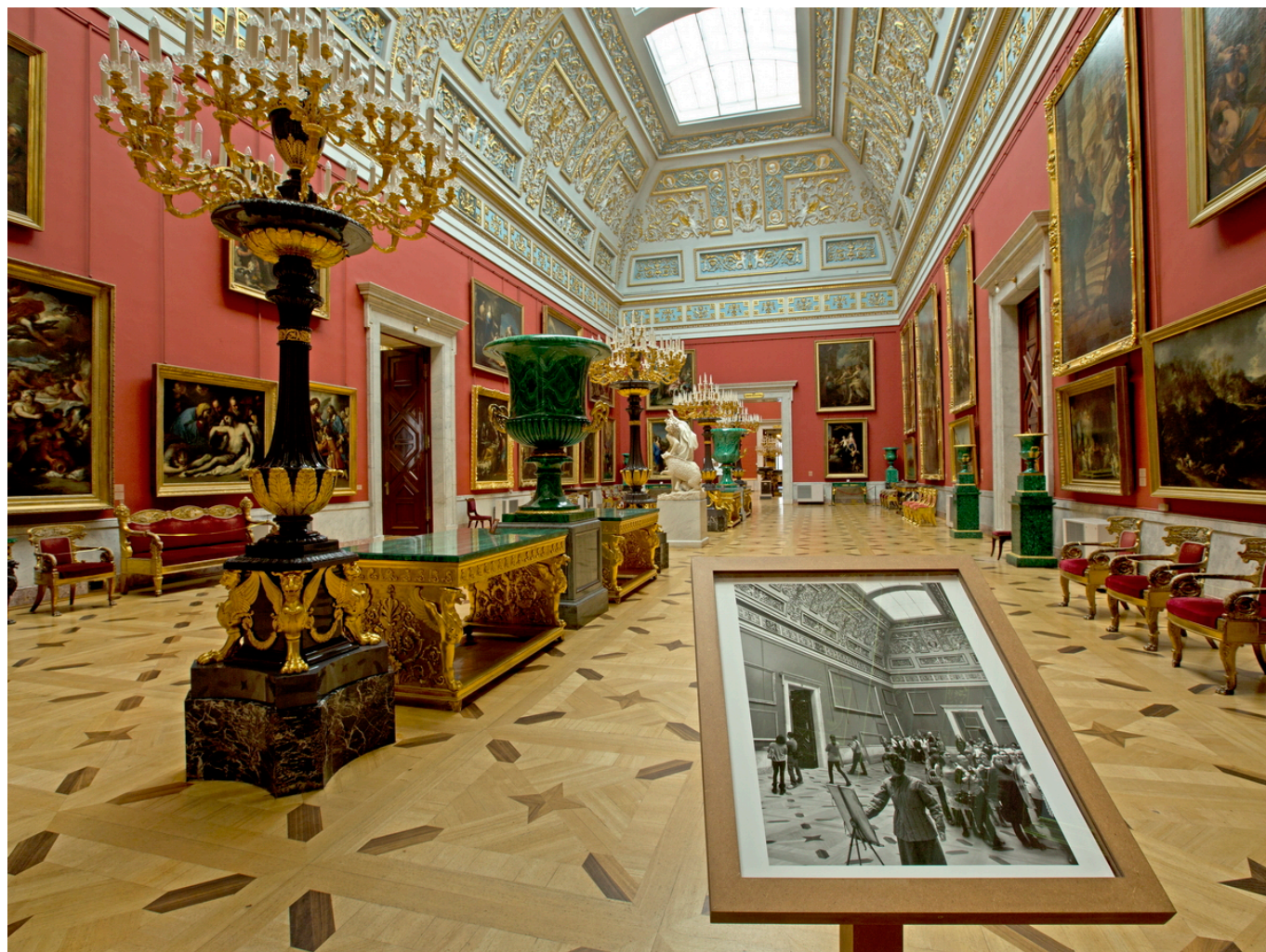
Моримура Ясумаса. Эрмитаж, 1941-2014. 2014 г.