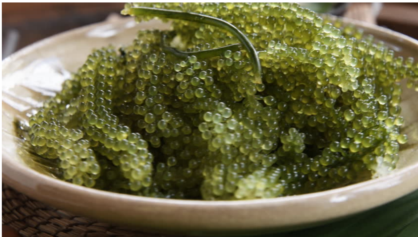
Вот она, зеленая икра

(черную) в своей продукции – прошел этот этап и Институт L.RAPHAEL, причем еще пять лет назад, и тоже накануне Каннского фестиваля , а к бриллиантовой пыли прибегал и того раньше. Теперь же научные сотрудники Института решили перейти от «икры находящейся в опасности рыб Каспийского моря» – читаем мы в пресс-релизе – к зеленой икре, получаемой из морских водорослей в японском городе Окинава.