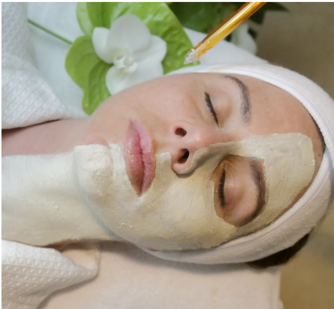
Маска из зеленой икры с бриллиантовой пудрой - must (с) L. RAPHAEL

К Каннскому фестивалю женевский Институт красоты L.RAPHAEL подготовил драгоценный подарок для всех красавиц – на этот раз в сотрудничестве с ювелирным брендом Chopard.