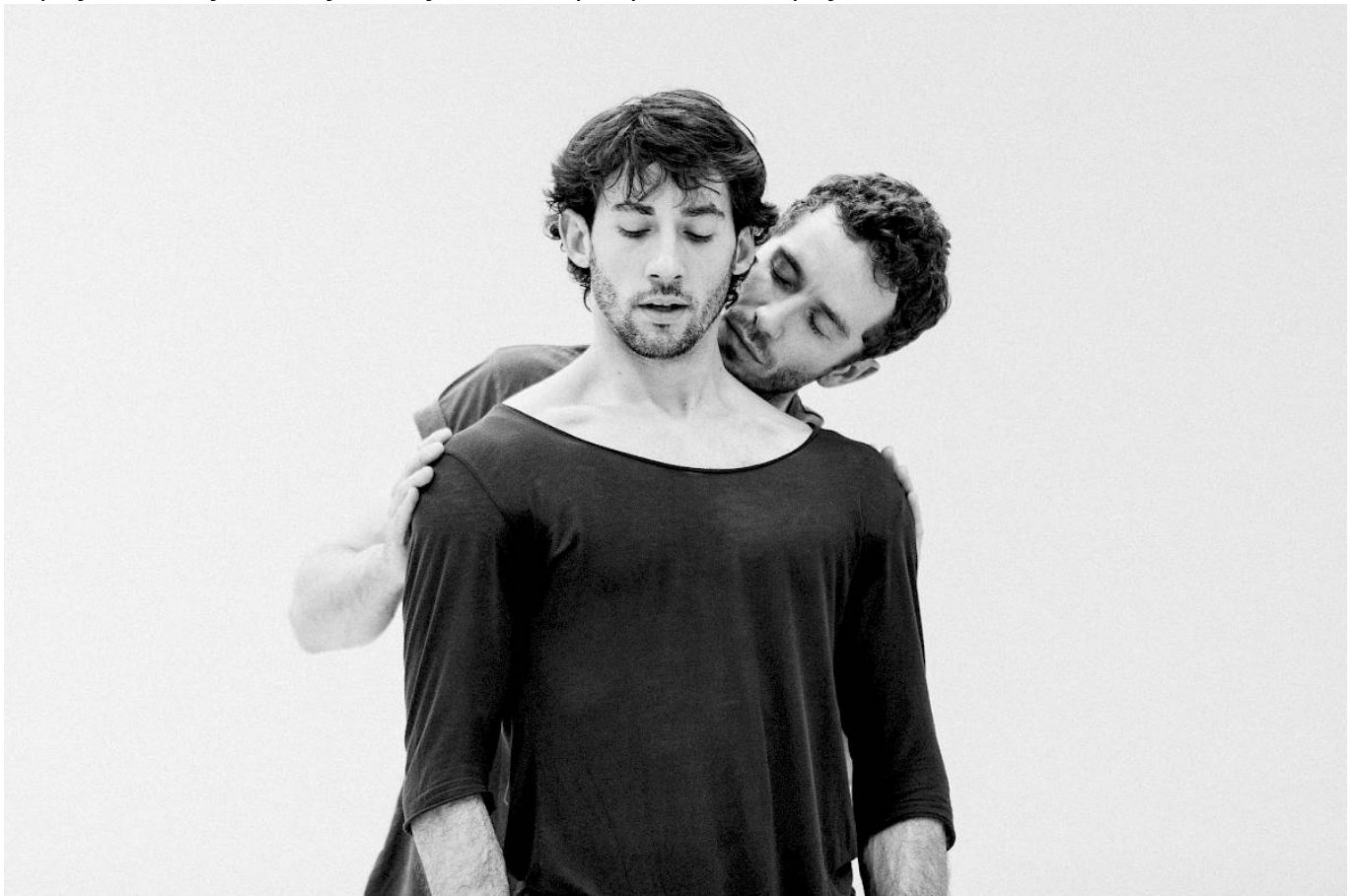
На репетиции балета "Нижинский" в Цюрихском оперном театре

Поощряемый Дягилевым, Нижинский попробовал свои силы как хореограф и втайне от Фокина репетировал свой первый балет — «Послеполуденный отдых фавна» на музыку К. Дебюсси (1912). Он построил свою хореографию на профильных позах, заимствованных из древнегреческой вазописи. Как и Дягилев, Нижинский был увлечен ритмопластикой и эуритмикой швейцарского композитора и педагога Жака Далькроза, давшего развитие особому роду танцевальному жанру, который возглавляли так называемые "босоножки" во главе с Айседорой Дункан. Именно в этой эстетике Вацлав Нижинский поставил в 1913 свой следующий и наиболее значительный балет, «Весна священная». Парижскую публику очаровал несомненный драматический талант артиста, его экзотическая внешность. Нижинский оказался смелым и оригинально мыслящим хореографом, открывшим новые пути в пластике, вернувшем мужскому танцу былой приоритет и виртуозность.