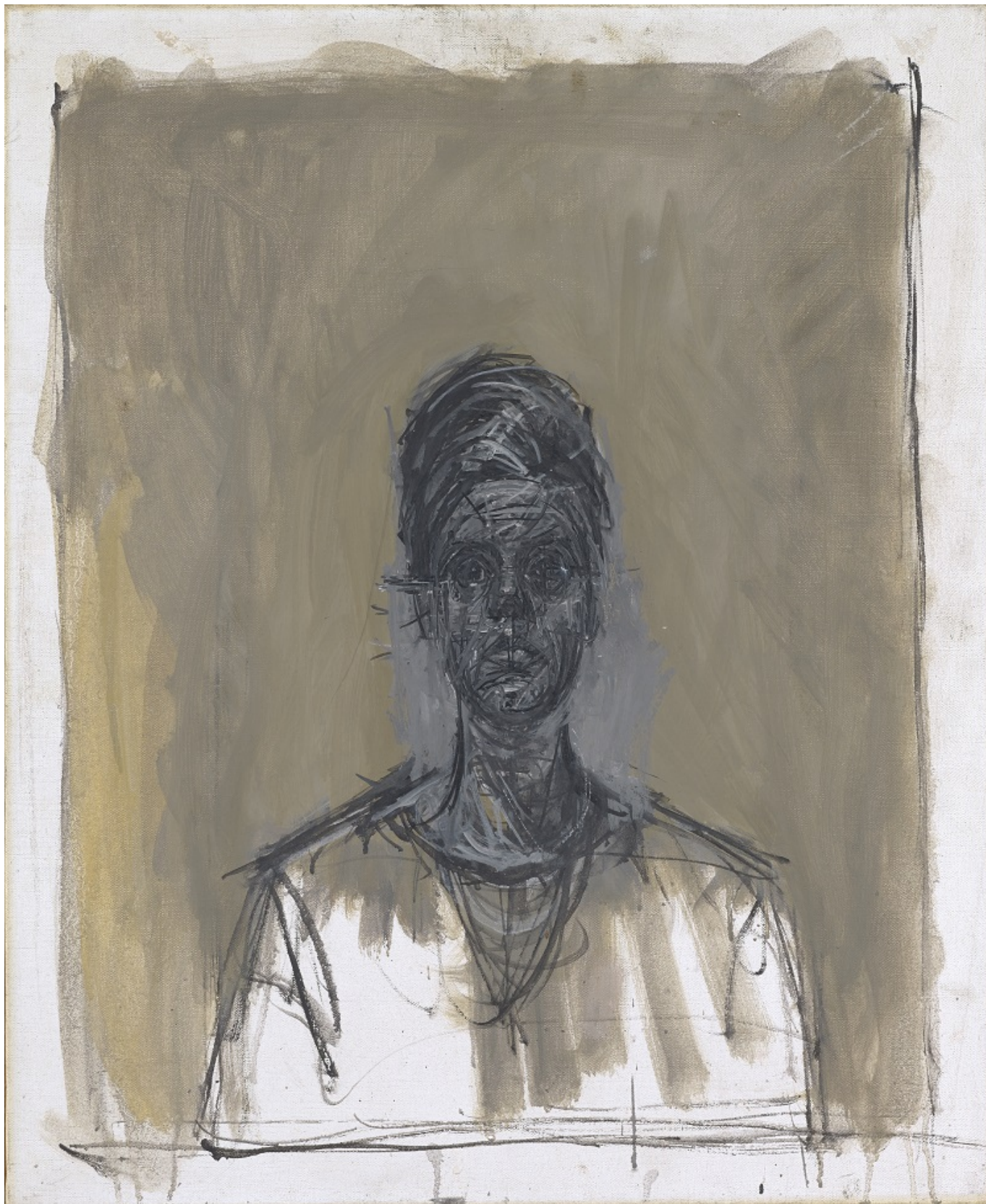
«Портрет Каролины», Альберто Джакометти, 1962 г.