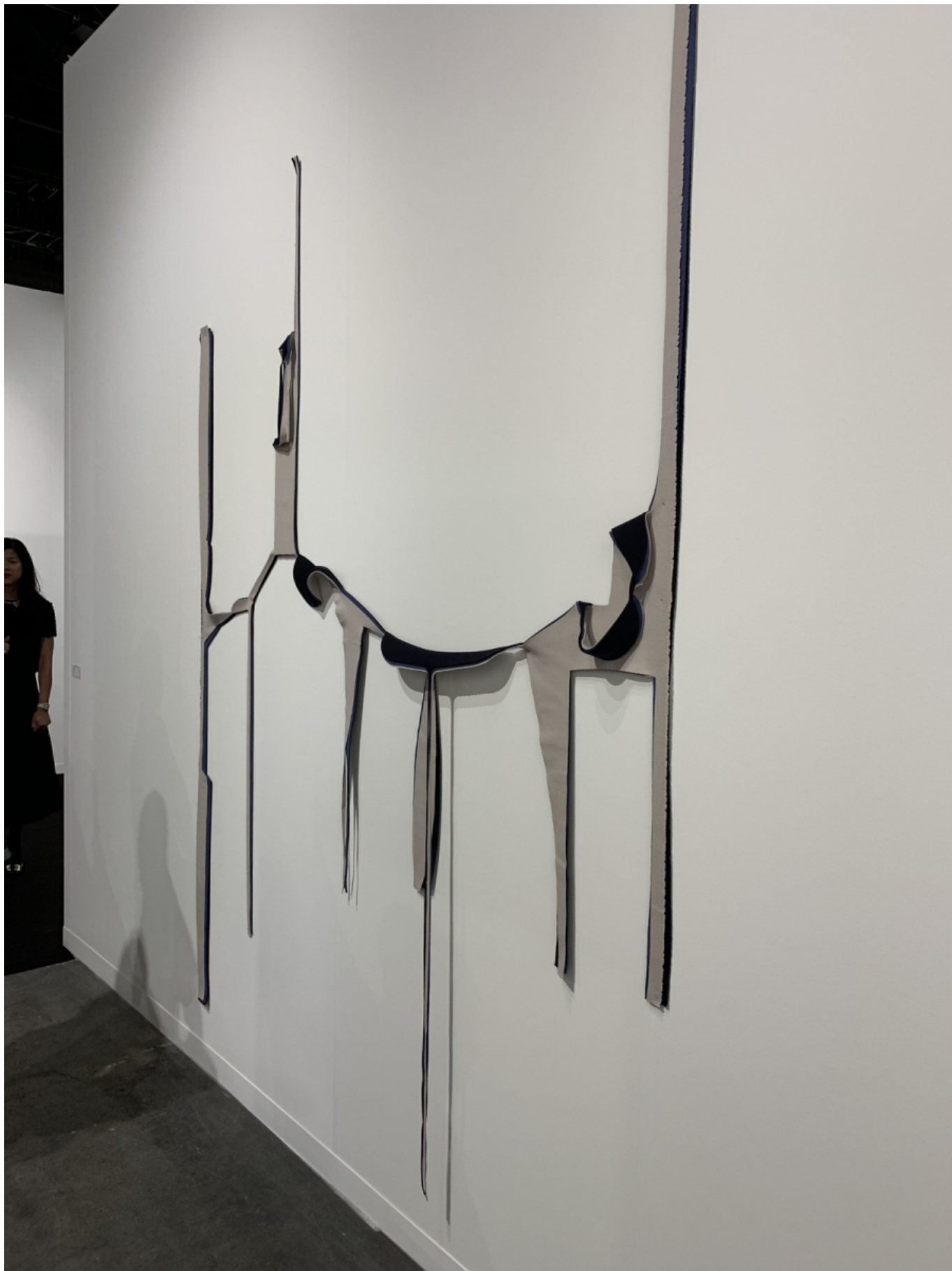
Фрагмент моновыставки Марион Барух