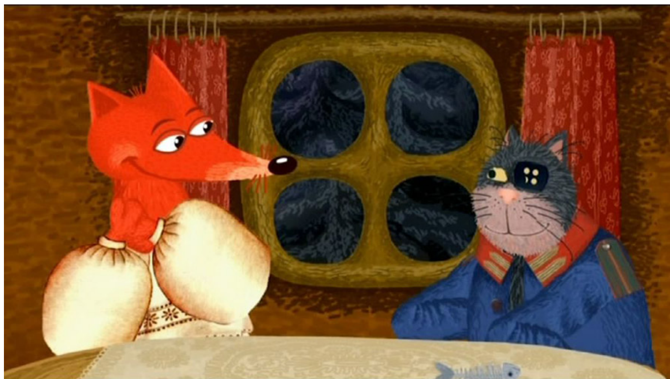
Кадр из мультфильма «Кот и лиса»

Идея «Горы Самоцветов» принадлежит легендарному режиссеру-мультипликатору и одному из основателей первой независимой советской студии анимации «Пилот» Александру Татарскому. На снятом им в 1981 году мультфильме «Пластилиновая ворона» выросло не одно поколение, а песню «А может, а может ...» на стихи Эдуарда Успенского и музыку Григория Гладкова помнит, наверное, каждый. Сейчас в это невозможно поверить, но в советские времена мультфильм хотели запретить, так как чиновники посчитали его «идеологически безыдейным». «Пластилиновая ворона» в свое время перевернула представления о том, какой должна быть анимация, и мультфильмы из цикла «Гора Самоцветов», в том числе и те, которые будут показываться во Фрибурге в это воскресенье, выполнены в очень похожем стиле: ироничные, современные и мастерски сделанные.