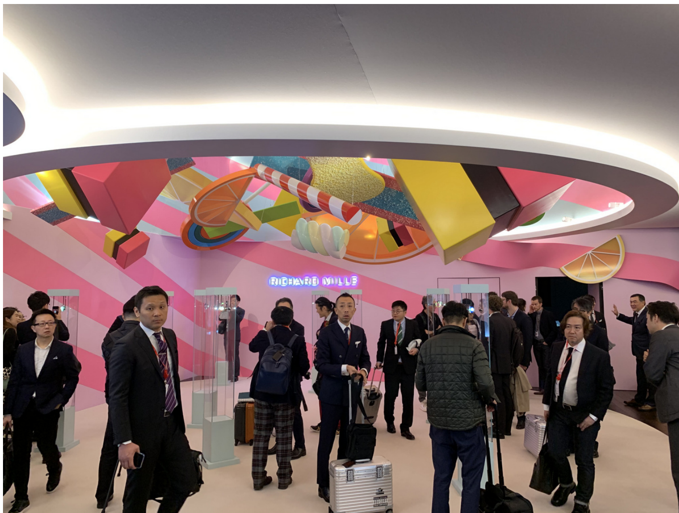
Бурлит жизнь на стенде Richard Mille, оформленном под конфетку

Однако не все считают, что игра стоит свеч. Мы уже рассказывали о том, что нынешний Салон – последний для двух ведущих часовых фирм, Audemars Piguet и Richard Mille . К уже переданной вам информации можно добавить, что обе эти фирмы – среди самых успешных в индустрии за последние десять лет. Audemars Piguet только что пересекла символический рубеж, зарегистрировав в 2018 году торговый оборот в размере 1,1 миллиарда франков. Richard Mille, основанная только в 2001 года, быстро заняла место среди лидеров – в 2018 году ее рост превзошел 15%, а торговый оборот – 300 миллионов.