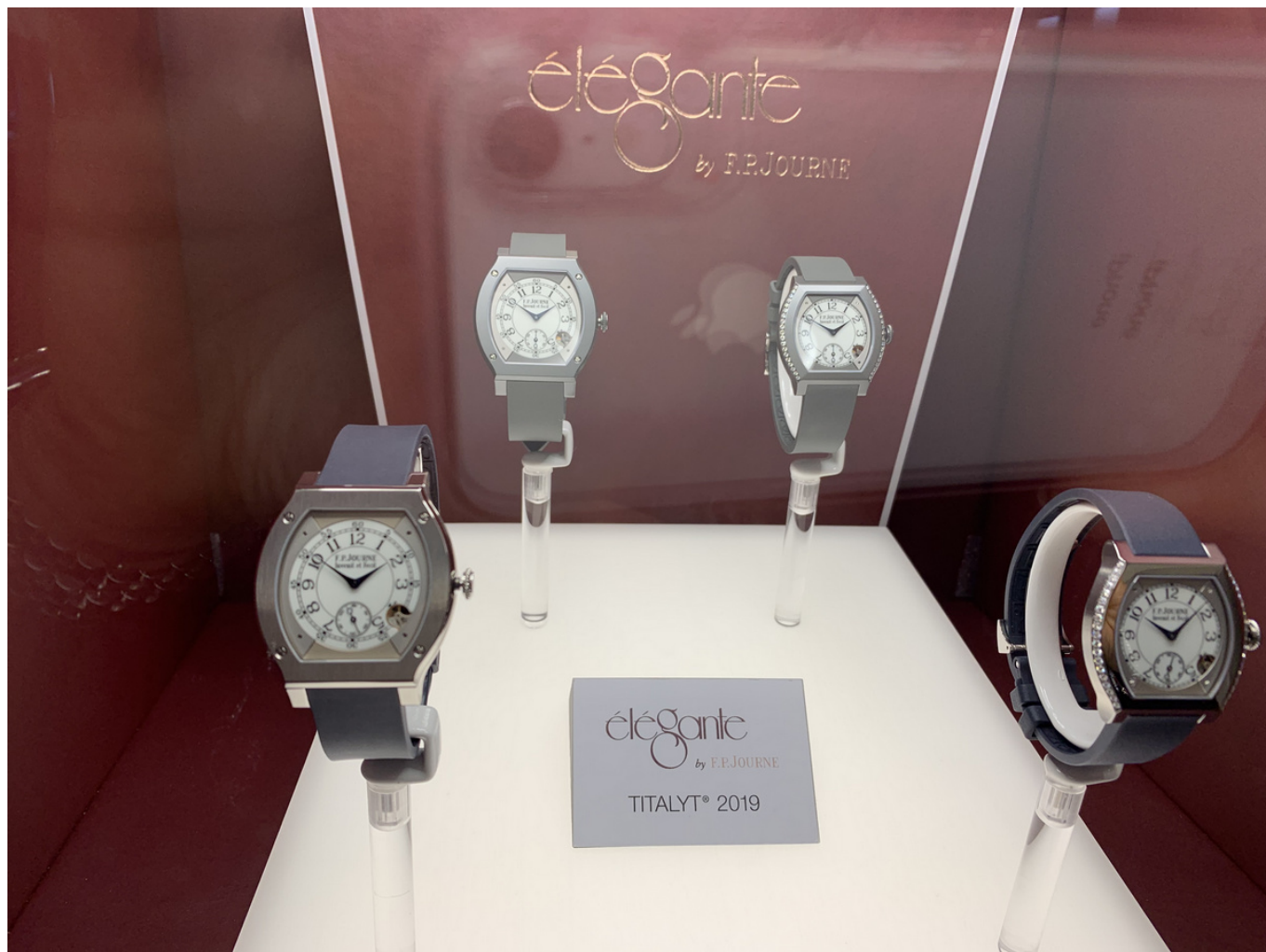
Elegante F. P. Journe - такая же элегантная и менее дорогая

Вторая новинка - знаменитая модель Elegante, но в облегченной и для запястья, и для кошелька варианте: не из платины или золота, а из титанила.