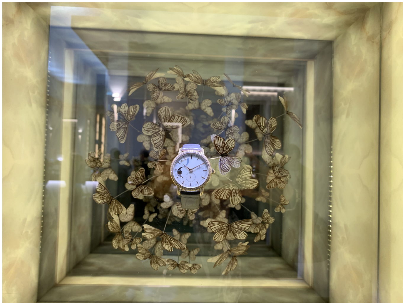
Почти набоковские бабочки Vacheron Constantin

Несмотря на все сложности, о которых так любят рассказывать представители швейцарской часовой индустрии – одной из важнейших статей национального экспорта, Салон, начавшийся с дружеской вечеринки накануне официального открытия, без преувеличения ослепляет своим великолепием: так и хочется, перефразируя Пушкина, сказать «тут люксом пахнет». Каждый из стендов – а в некоторых случаях, как Cartier, речь идет о целых павильонах – это отдельное произведение дизайнерского искусства. Все постарались на славу, каждый в своем стиле: от капитанской рубки Christophe Claret и тикающих и плавающих акул Ulisse Nardin до просто золота, но в больших количествах De Witt. Подойдя к стенду Vacheron Constantin, мы восхитились избранной брендом темой природы – перышки, птички, часы вместо кошачьих глаз и прочие бабочки выглядят восхитительно. Однако уже через несколько метров поняли, что это только... бабочки, а вот Jaeger-Le Coultre высадил в своем павильоне целый лес, с настоящими шишками; посетители, рассматривая часы, одновременно наслаждаются пением птиц!