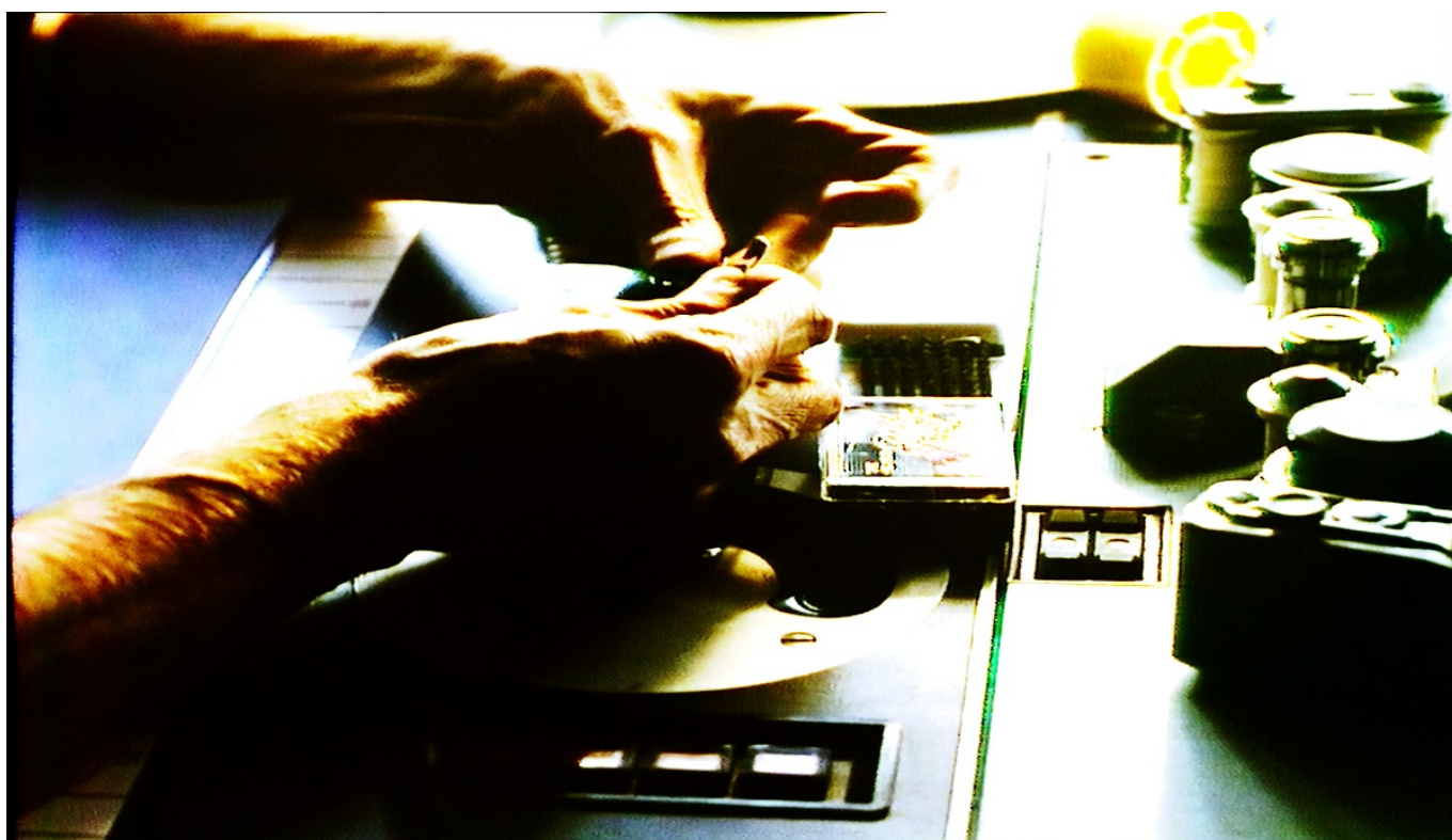
Кадр из фильма «Книга образа»

Премьера его нового фильма «Книга образа» (франц. Le Livre d'image ) состоялась весной этого года в Каннах, и это само по себе примечательно. Дело в том, что 50 лет назад, в мае 1968 года, Годар вместе с Франсуа Трюффо, Клодом Лелюшем и другими представителями «Новой волны» буквально сорвал Каннский кинофестиваль. Режиссеры заявили о недопустимости развлечений в то время, как парижские студенты борются за свои права, рискуя жизнью на баррикадах. Обвинив жюри (в составе которого был, например, Роман Полански) в трусости, радикальные кинематографисты и их сторонники вышли на набережную, двинулись в сторону кинотеатра, где должен был демонстрироваться фильм конкурсной программы «Мятный коктейль со льдом» Карлоса Сауры, и повисли (!) на занавесе. Протестующие добились того, что показ отменили, фестиваль закрыли, наград никому не раздали – и все это не без помощи Годара.