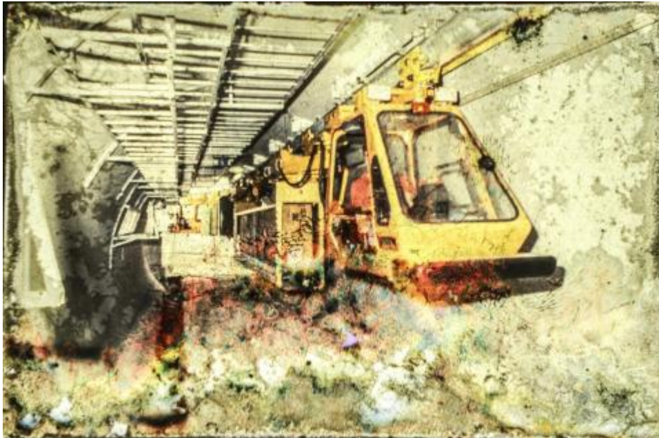
Звездная пыль (volmeur.web.cern.ch)

Проект, запущенный в 2016 году, называется по-французски «Mémoire digitale» («Цифровая память»). В его рамках физики решили перевести в цифровую форму 450 000 снимков. Около ста из них, сделанные в 1980-х годах во время строительства Большого электрон-позитронного коллайдера (LEP), были обнаружены в старом шкафу в одном из подземных хранилищ. Покрытые пылью и плесенью, они сильно пострадали под воздействием микроорганизмов: на них появились разноцветные пятна, напоминающие картины художников-абстракционистов.