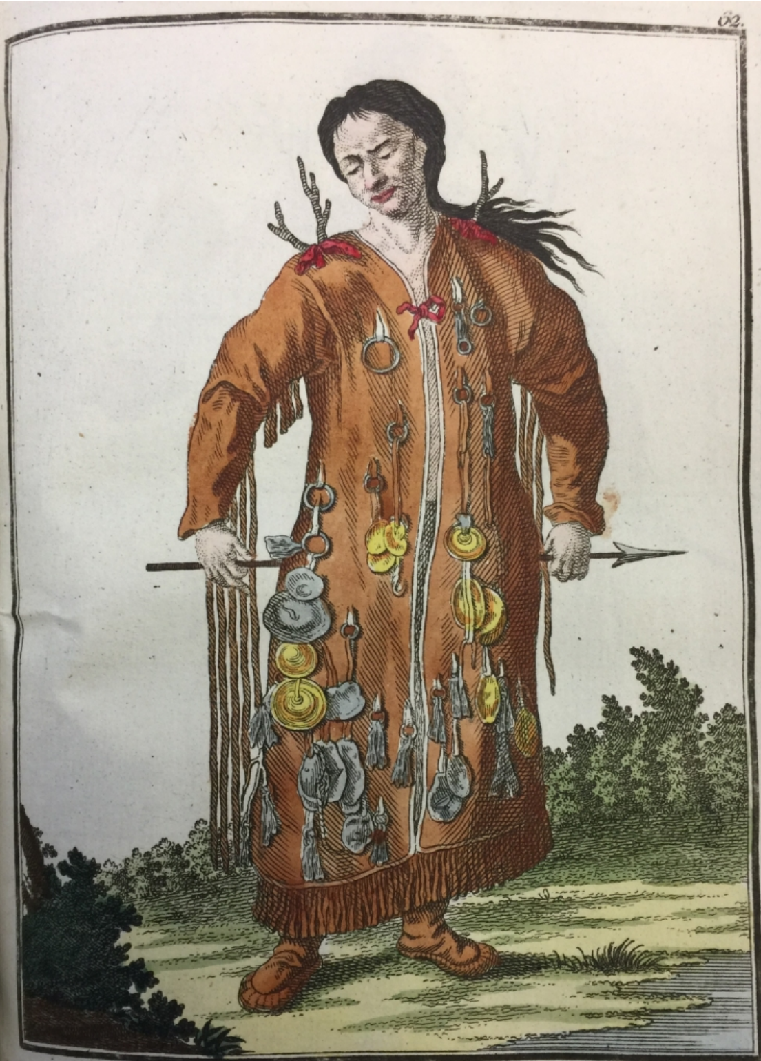
Тунгуской Шаманъ при рѣкѣ Арлунъ съ лица. Ein Tungusischer Schamann am Argun Flufs vorwärts. Devin toungeuse auprès de l'Argoun par devant.

Тунгусский шаман, вид спереди. В книге: Иоганн Готлиб Георги: Описание всех в Российском государстве обитающих народов, также их житейских обрядов, вер, обыкновений, жилищ, одежд и прочих достопамятностей. Том 3. Санкт-Петербург, 1777.