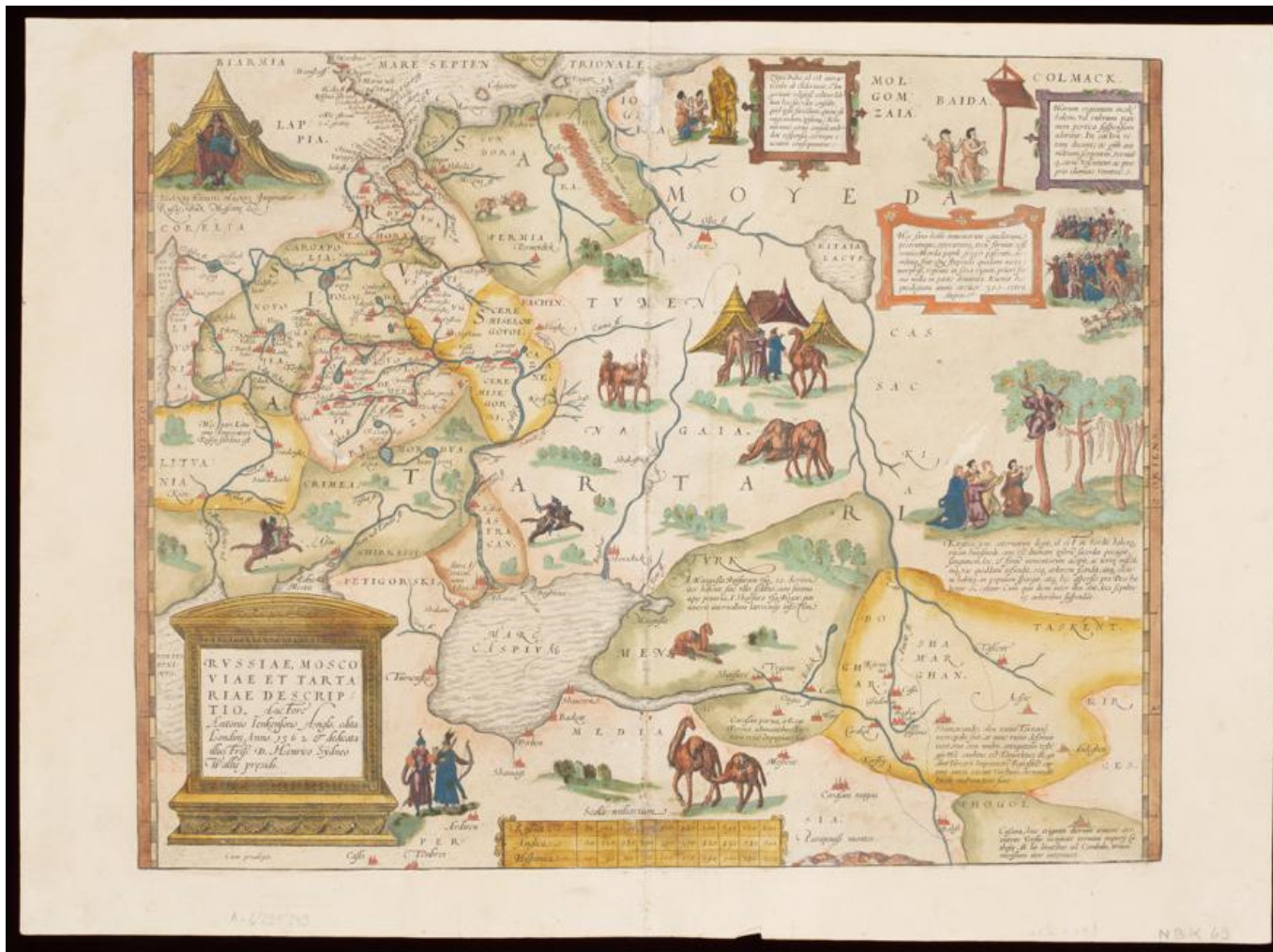
Rvssiae, Moscoviae et Tartariae descriptio Карта Руси, Московии и Тартарии, опубликована в Лондоне в 1562 году. Автор Энтони Дзенкинсон. (Jenkinson, Anthony: Rvssiae, Moscoviae et Tartariae descriptio. Edita Londini anno 1562)

Мы продолжаем повествование, начатое неделю назад . Сегодня вы узнаете о коллекции "Rossica Europeana", собранной русофилом-автисоветчиком и хранящейся в Берне.