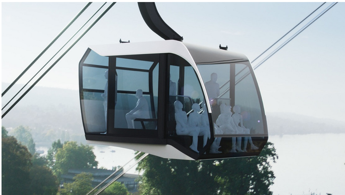
Дизайн кабин выполнен по заказу ZKB

Прежде всего, банк сообщил, что в конце октября подал соответствующие документы в федеральный департамент транспорта и надеется получить разрешение на строительство канатной дороги летом 2019 года. Напомним, что город и кантон уже дали свое одобрение. Если на федеральном уровне проект также получит «зеленый свет», то строительные работы могут начаться следующей осенью, а сама дорога откроется в 2020 году и проработает в течение пяти лет.