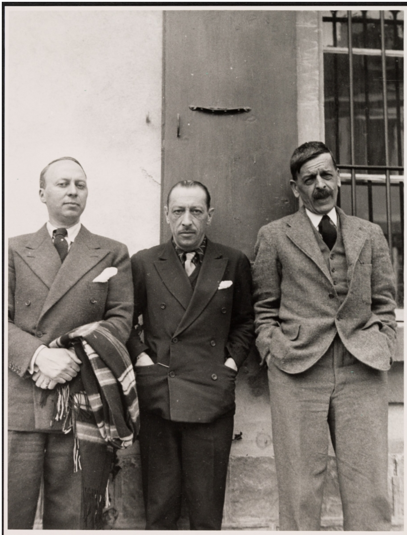
Эрнест Ансерме, Игорь Стравинский и Шарль-Фердинанд Рамю, 1918 г.

Мало кто знает, однако, что невероятным образом связь между Стравинским и Швейцарией существовала задолго до его первого приезда в Альпы: Игорь