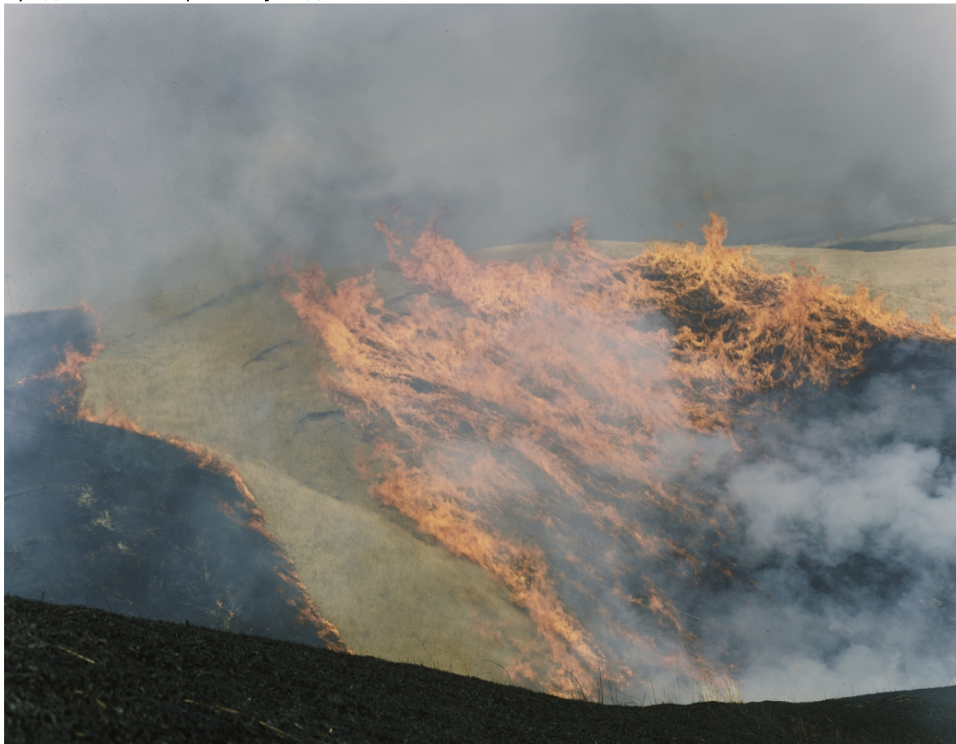
Ринко Каваучи. Без названия, 2012 г. (© Rinko Kawauchi, Prix Pictet 2017)

благодаря которому интересующиеся могут детально ознакомиться с биографией и работами каждого из финалистов. «Собранные здесь восхитительные фотографии показывают нам, почему необходима новая экономическая модель – модель всемирная, основанная на кооперации, никого не исключая, учитывающая экологические вызовы и имеющая под собой научную основу», – написал почетный президент премии Prix Pictet, бывший Генеральный секретарь ООН Кофи Аннан в предисловии к третьему изданию.