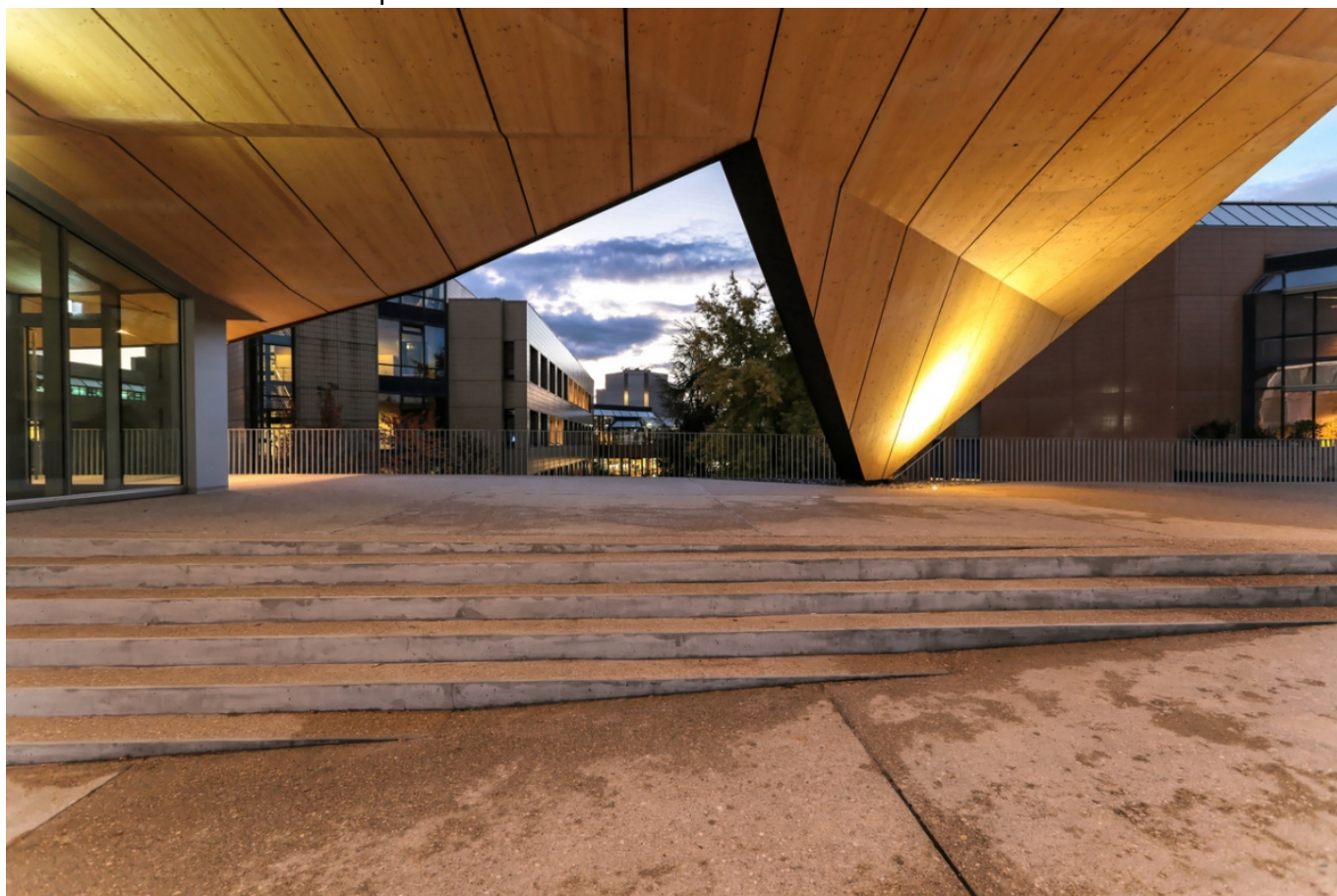
Лаборатория искусств EPFL