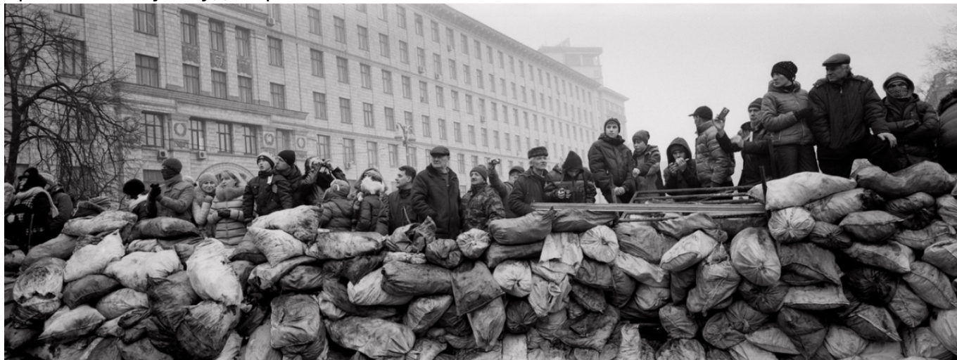
Павел Вольберг. Гражданское население Украины за баррикадой наблюдает за полицией на Майдане, Киев, 2014 г. (© Pavel Wolberg, Prix Pictet 2017)

Возможно, фотография более доступна широкой аудитории. Как выразился один мой знакомый, фотография – это искусство не ради искусства, но ради нас. По-моему, тонко схвачено. А о значении фотографии свидетельствует, например, тот факт, что наши выставки с удовольствием принимают многие художественные музеи, которые вряд ли заинтересовались бы просто художественной фотографией, не имеющей социальной направленности, актуального содержания. Возможно, такая готовность к сотрудничеству со стороны музеев отвечает и их стремлению «осовремениться», привлечь новую аудиторию.