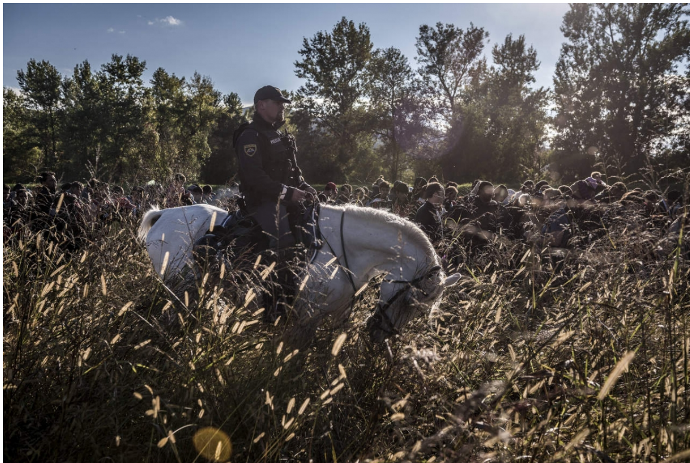
Сергей Пономарев. Конная полиция сопровождает сотни мигрантов после их перехода из Хорватии в Словению, 20 октября 2015 г. (© Sergey Ponomarev, Prix Pictet 2017)

Швейцарские банки, как и вообще Швейцарская Конфедерация, всегда соблюдают осторожность, придерживаются нейтральных оценок. Тем не менее от цикла к циклу вы избираете темы, которые нейтральными не назовешь. Вот и среди фотографий, отобранных в этом году, многие посвящены миграции, беженцам, то есть темам, остро стоящим на политической повестке дня.