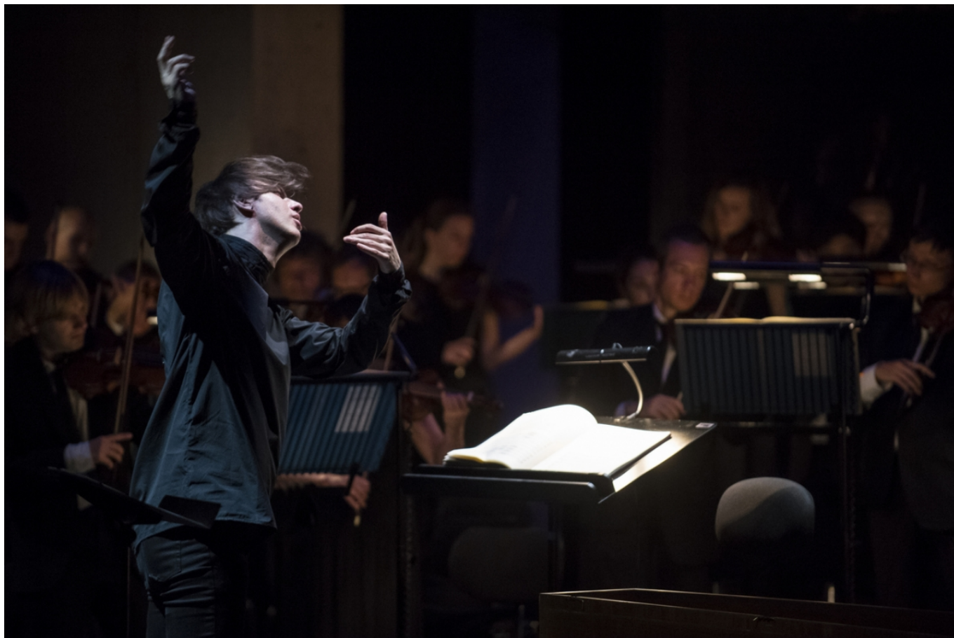
Теодор Курентзис

И еще одна новость, которая наверняка обрадует многих наших читателей: 8 апреля 2019 года в Женеву вернется уже почти совсем наш Теодор Курентзис. На этот раз давно живущий в Перми греческий музыкант представит швейцарской публике «Реквием» Верди. Такое нельзя пропустить!