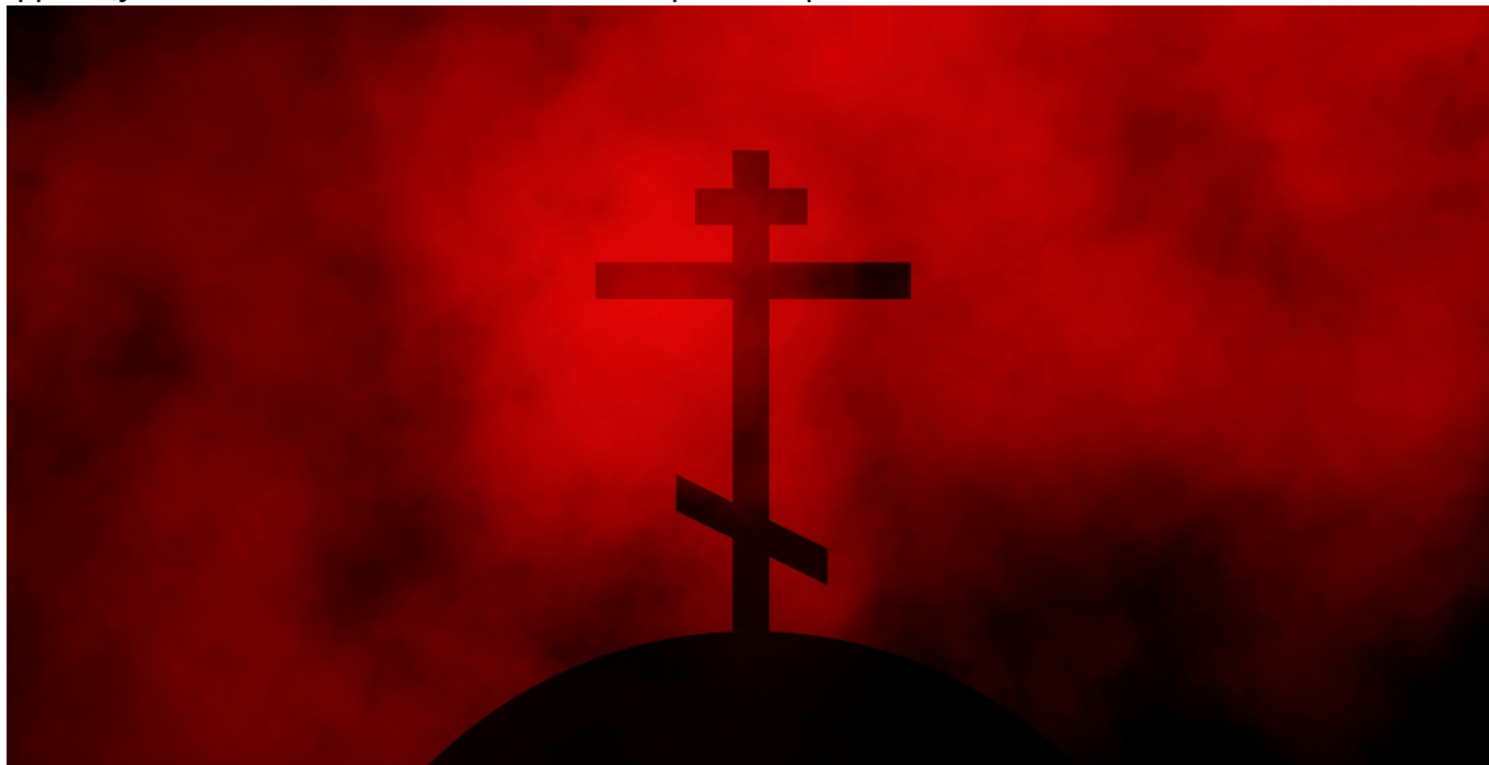
Православный крест - символ Руси времен Бориса Годунова