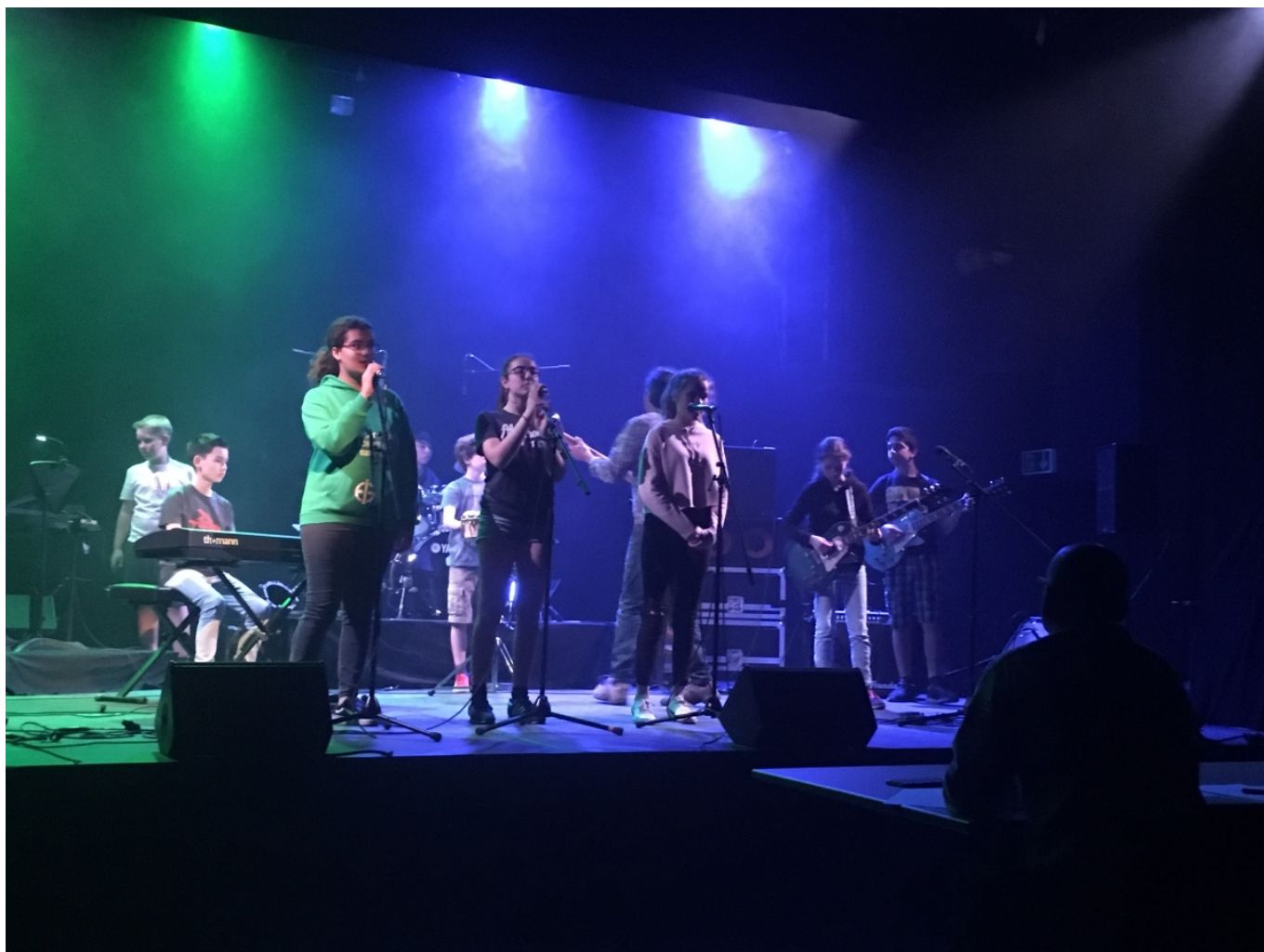
Выступает группа Международной школы Женевы

Не все представленные группы были равны по возрасту, степени подготовки и качеству исполнения. За «команду» Международной школы Женевы, например, выступали двое взрослых, что, на наш взгляд, несправедливо. Зато абсолютно справедливым мы нашли решение жюри, объявившего, что главное в этом проекте – позитивная энергия и присудившего победу группе Международной школы Лозанны – их прекрасной солистке смело можно пробовать на участие в «Голосе»! А в Швейцарскую лигу борьбы с раком было передано 1205 франков - не очень много, но это же только первая проба.