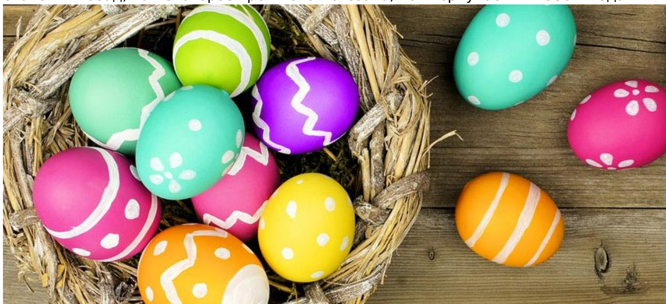
Мастер-классы по раскрашиванию яиц, созданию фигурок и много других занятий (adelboden.ch)

2 апреля в Бремгартене (кантон Аргау) пройдет пасхальный рынок, где, кроме прочего, продаются изделия местных мастеров, а для детей открыт луна-парк; тем временем в Устере (кантон Цюрих) состоится охота за яйцами... только здесь участникам придется нырять за ними в ледяные воды озера Грейфен. А в некоторых кварталах Цюриха дети могут заработать немного денег благодаря игре Zwänzgerle. Игра состоит в том, что взрослые бросают монету в 20 сантимов в яйцо, которое принес ребенок. Если монета вонзится в яйцо, то взрослый может его съесть, если нет, то яйцо остается у ребенка, а заодно и монета. Игра эта появилась несколько столетий назад, на некоторое время она исчезала, но «вернулась» в 1930-х годах.